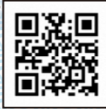
あおり漁師への道