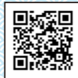
青森県漁業就業者 確保育成センター