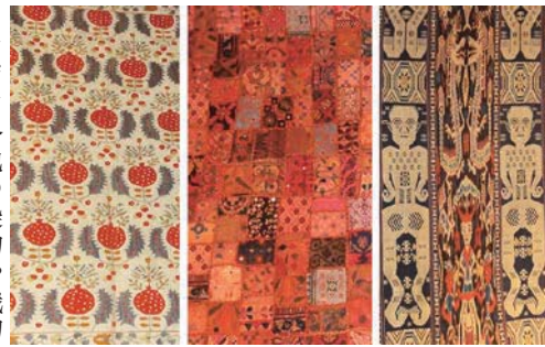
右からイカット(インドネシア)・ミラー刺繍布(インド)・スザニ(中央アジア)

◆夏の企画展「アジアの民の染めと織り」布が奏でる大地の物語 2 in acaコレクション!