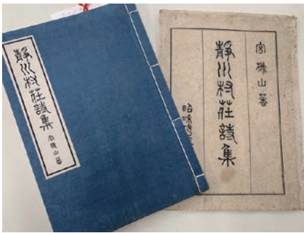
第一集『静川村莊詩集』