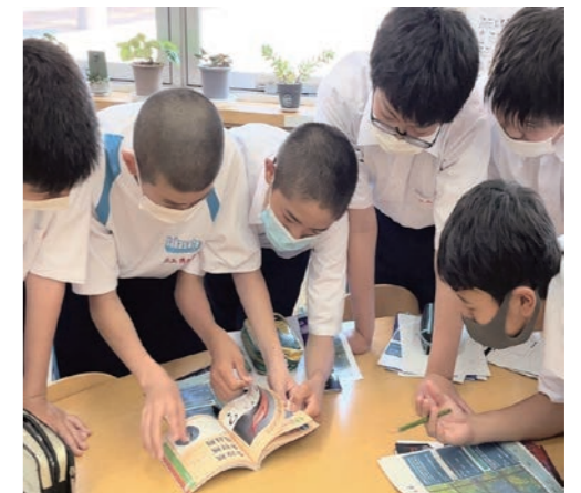
※なお、新型コロナウイルス感染拡大防止のため、9月30日(木)まで休館とさせていただきます。

6月28日(月)、『ようこそ図書館へ!』と題し、総合学習「図書館活用ガイダンス」が開催され、中里中学校1年生37名が参加しました。 図書館の機能を知って上手に使いこなすための学習や、図書館案内、読み聞かせ、クイズにも取りくみました。 生徒からは「〈日本十進分類法〉(NDC)のしくみを知ることができたので勉強になった。これからは自分の読みたい本を探して図書館を使いこなしたい」などの感想が寄せられました。