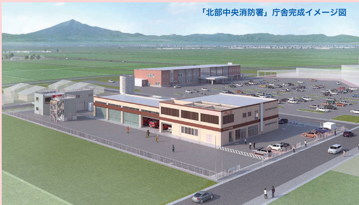
「北部中央消防署」庁舎完成イメージ図

組合では令和4年4月から、より機能的に業務を推進するために、これまでの6消防署1分署の体制から、五所川原消防署、鶴田消防署、北部中央消防署の3署と、五所川原消防署に東分署と金木分署を、北部中央消防署に市浦分署と小泊分署を配置する3消防署4分署体制とします。