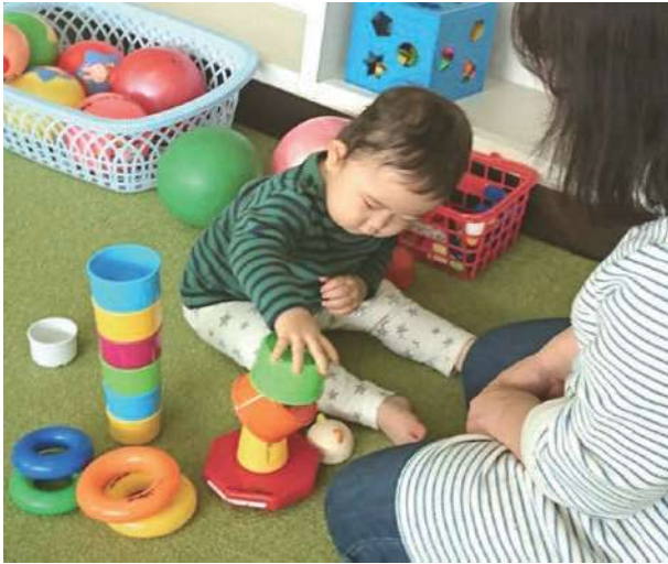
提供会員とブロック遊びに夢中 五所川原市働く婦人の家・託児室での様子

五所川原市以外のつがる市、鱒ヶ沢町、深浦町、鶴田町、中泊町の5市町の方も五所川原市ファミリー・サポート・センターの入会登録ができるようになりました。