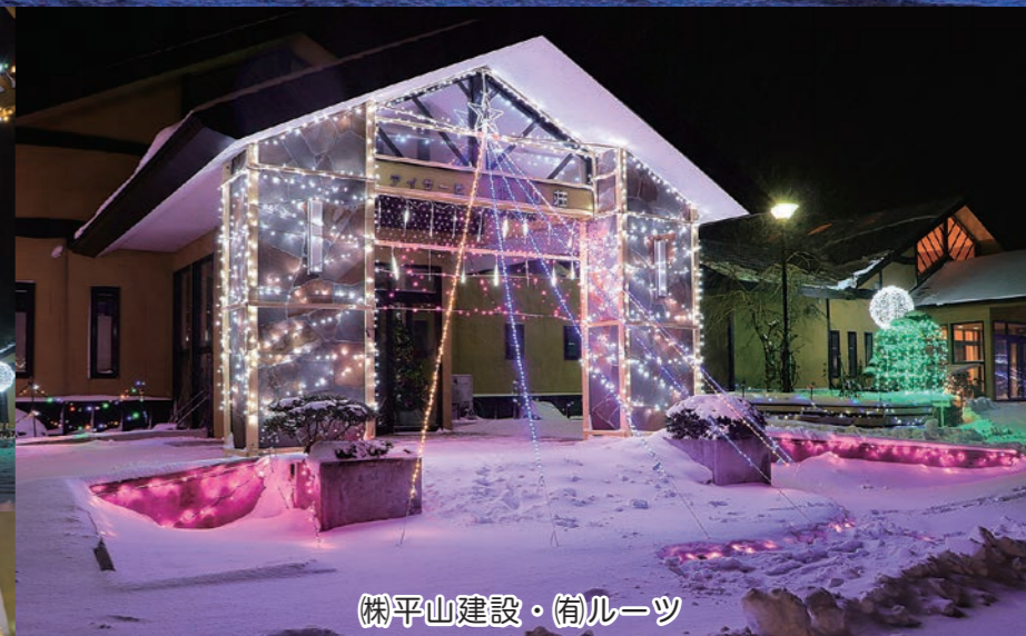
株式会社 平山建設 (株) ルーツ