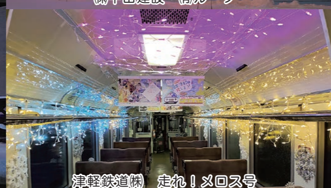
津軽鉄道(株) 走れ! ヌロス号