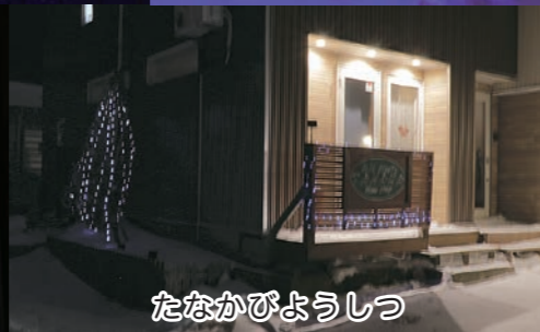
たなかびようしつ