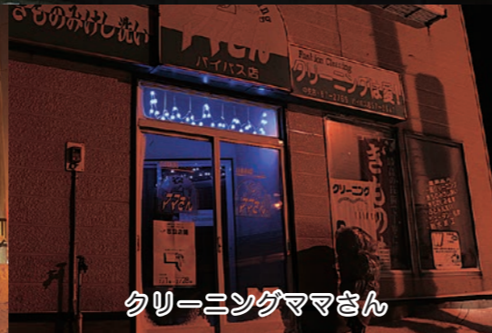
クリーニングママさん