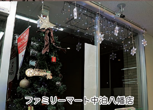
ファミリーマート中泊八幡店