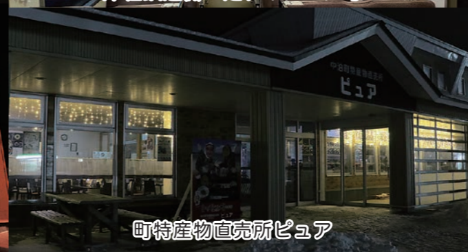
町特産物直売所ピュア