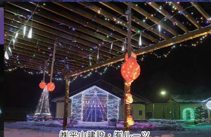
株式会社 平山建設 (株) ルーツ