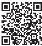
県立美術館HP QRコード