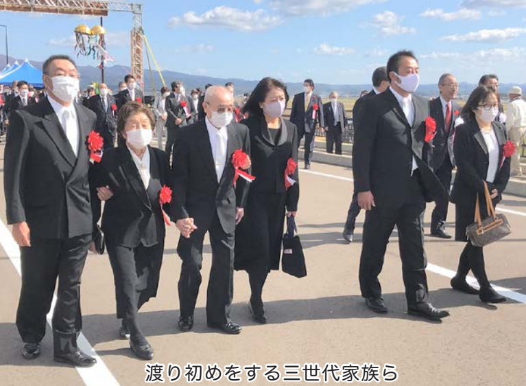
渡り初めをする三世代家族ら