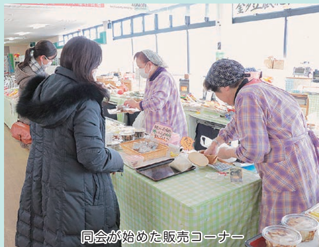
同会が始めた販売コーナー

4月からの駅ナカにぎわい空間の管理運営者は、広報なかどまり2月号で募集したとおり、3月中旬に会議・審査を経て決定する予定です。