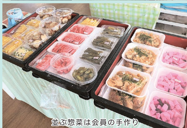
並ぶ惣菜は会員の手作り