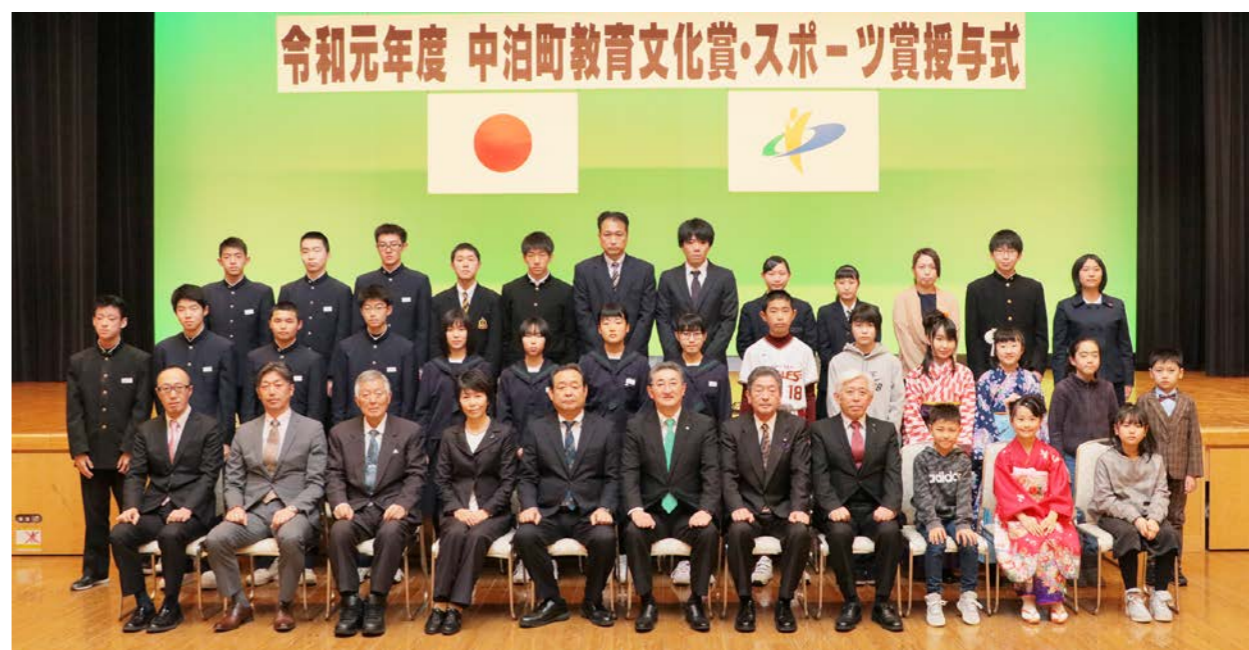
令和元年度 中泊町教育文化賞・スポーツ賞授与式