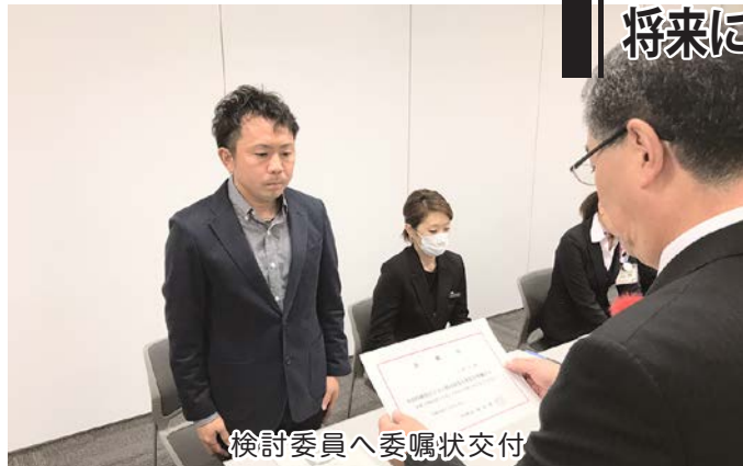
検討委員へ委嘱状交付

策定委員会の委嘱状交付式では濱館町長が、これまで明確な観光戦略がなかったことに触れながら「『選ばれる中泊町』を委員の皆さんと共に作っていきたい」と話しました。