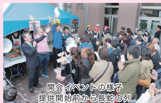
開会イベントの様子 提供開始前から長蛇の列

料理開発を重ね生徒たち自らの手で収穫したジョロキアを使った4品を提供し、食べた人の投票によって順位を決めました。結果は、特製激辛ラー油を加えた「マーボーラーメン」がグランプリとなりました。グランプリの料理は今後、町内の店舗などで提供が予定されています。