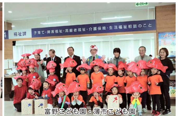
富野こども園・薄市こども園