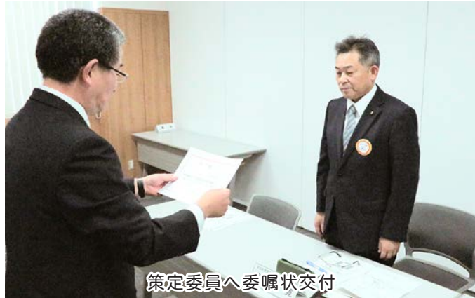
策定委員へ委嘱状交付