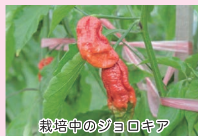
栽培中のジョロキア