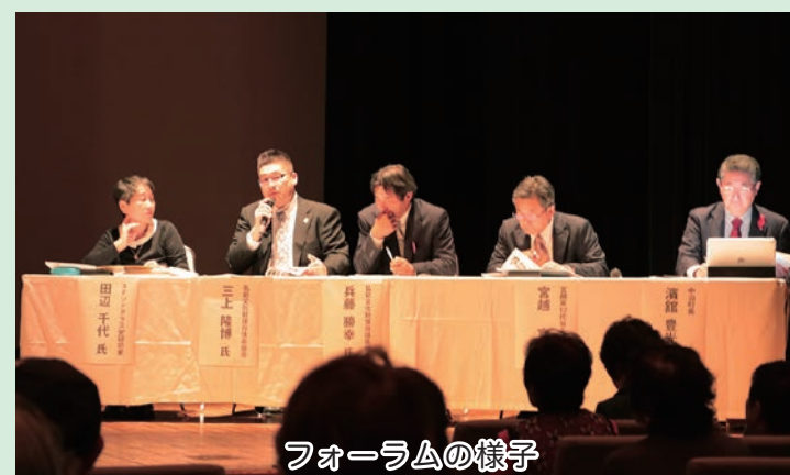
フォーラムの様子