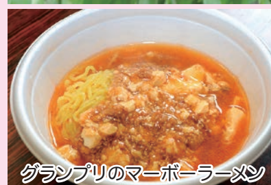
グランプリのマーボーラーメン

地域資源を活用して活性化を図ろうと取り組みを展開し、「メバ焼き！」でおなじみの中里高校SBPが、新たな取り組みに挑戦しました。