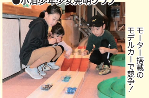
モーター搭載のモデルカーで競争！