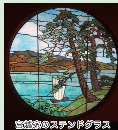
宮越家のステンドグラス