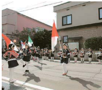
中里こども園防火演奏

津軽中里駅から出発したパレ ードには、中里こども園・富 野こども園の園児約80名が参 加し、防火演技や演奏を行い、 沿道に詰めかけた町民から盛 大な拍手を受けていました。