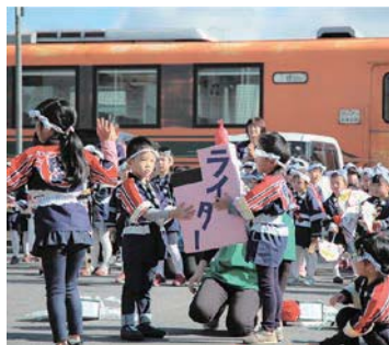
富野こども園防火演技

10月21日(月)、秋の火災予防 運動の一環として幼年消防ク ラブ防火パレードを実施しま した。町民に防火意識の高揚 を図るため、各団体が参加し 火災予防を呼びかけました。