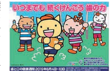
歯と口の健康週間 2019年6月4日-10日

口腔の健康は口だけにはとどまりません。口の健康が全身の健康にも影響していることがわかってきました。