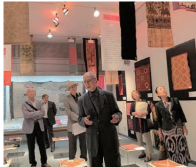
ギャラリー・トーク