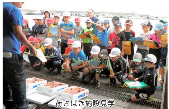
荷さばき施設見学