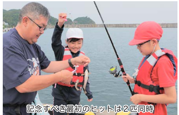
記念すべき最初のヒットは2匹同時

体験学習は7月3日(水)にも実施され、武田小学校6年生、薄市小学校2年生、小泊小学校3年生、小泊中学校2年生が参加しました。この事業は、7ヶ年計画で進められ、学年毎に異なる内容で複数回にわたる体験学習が展開され、町内全校で行われます。