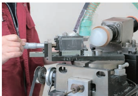
当時、自社製作した切削加工装置。改良を重ね、微調整が必要なときは今でも使用している。

「本当に嬉しかった。自慢できる物ができたんだ」と当時の気持ちを語る。発注者は出来映えに驚いて、生産現場の視察に訪れたという。次第に発注量も増えていった。樹脂ボールの完成がV字回復の起点となったのだ。苦境が確かな糧につながり、医療機器用の樹脂ボールを一貫生産できる国内唯一の存在となっている。