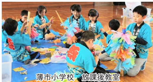
薄市小学校 放課後教室