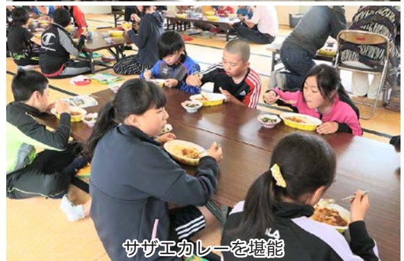
サザエカレーを堪能