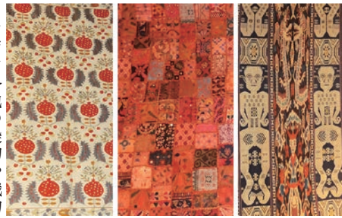
右からイカット(インドネシア)・ミラー刺繍布(インド)・スザニ(中央アジア)

◆夏の企画展「アジアの民の染めと織り」布が奏でる大地の物語 2 in acaコレクション!