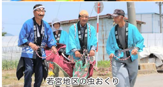
若宮地区の虫おくり