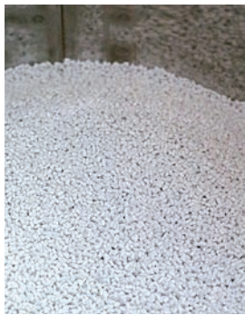
成形前のペレット。平均1mm×2mmほどで、最大320度で熱する。

同社はプラスチック成形を手掛ける企業として、この地域に平成2年に創業。当時、関東方面では脱サラをして、プラスチック成形業を始める者が少なくなかった頃、この地域には金型を製作する企業はあったが、試作・生産を担う成形を手掛ける企業がなかった。「成形をやってくれるところはないか」という地域の金型メーカーの声に応えたのが同社だった。