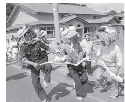
昭和51年 高根虫送り

中泊町中里地域においては、五穀豊穣を祈願する農耕儀礼が、正月行事を皮切りに一年を通じて行われてきました。 なかでも、田植え終了後のサナブリ休みに行われる「虫送り」は最大の行事です。稲に付く害虫を追い払うという趣旨で、サナブリ太鼓を打ち鳴らしながら、荒薬で編んだ「虫」を先頭に、荒