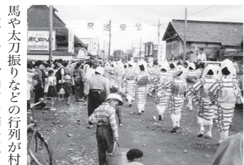
昭和40年 富野虫送り

馬や太刀振りなどの行列が村中を練り歩き、神官や獅子頭・大名行列・山車のほかに、傘袋といて、和傘にいろいろな装飾品を吊り下げたものや、男女ペアの藁人形などが加わった時期もありました。 残念ながら、春を彩るこれらの祭礼は、農耕社会の変質や少子高齢化に伴う担い手の不足等によって、目にする機会が少なくなってきました。