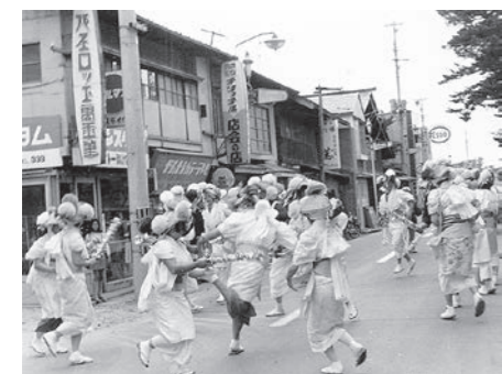
昭和49年 中里虫送り