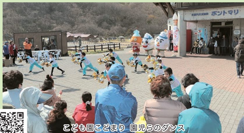
こども園こどもり 園児らのダンス

17回目の開催となる竜泊ラインウォーキングが、4月20日(土)に開催されました。今年は、眺眺台からスタートのAコース(12.5km)と、坂本台からスタートのBコース(6.5km)の2コースで、合計200人以上が竜泊ラインの絶景を堪能しました。参加者たちは写真を撮ったり談笑しながらゴールの折腰内オートキャンプ場を目指しました。ゴールした後はお楽しみの抽選会。今年は、春の味覚のヤリイカやアワビ、サザエ、そして中泊町特産の津軽海峡メバルなど海の幸が盛りだくさんで、抽選番号が引かれる度に、参加者たちは歓声をあげ、楽しんでいました。