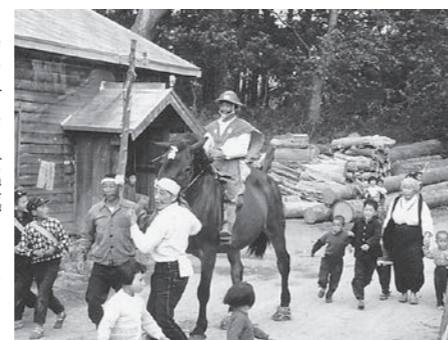
昭和36年 深郷田虫送り

中泊町中里地域においては、五穀豊穣を祈願する農耕儀礼が、正月行事を皮切りに一年を通じて行われてきました。 なかでも、田植え終了後のサナブリ休みに行われる「虫送り」は最大の行事です。稲に付く害虫を追い払うという趣旨で、サナブリ太鼓を打ち鳴らしながら、荒薬で編んだ「虫」を先頭に、荒