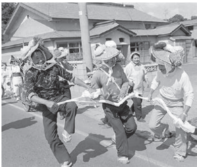
昭和51年 高根虫送り

残念ながら、春を彩るこれらの祭礼は、農耕社会の変質や少子高齢化に伴う担い手の不足等によって、目にする機会が少なくなってきました。