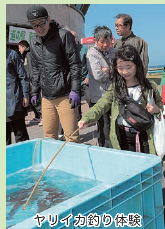
ヤリイカ釣り体験

園児たちによるダンスから始まり、小泊地域でとれた海産物や活ダコのかまゆで実演販売もありました。特に、旬のヤリイカは、大勢の来場者が買い求めていました。