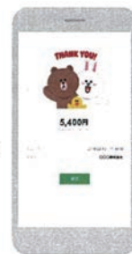
内容を確認して支払い完了!