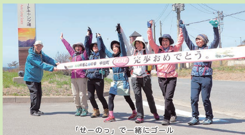
「せーのっ」で一緒にゴール