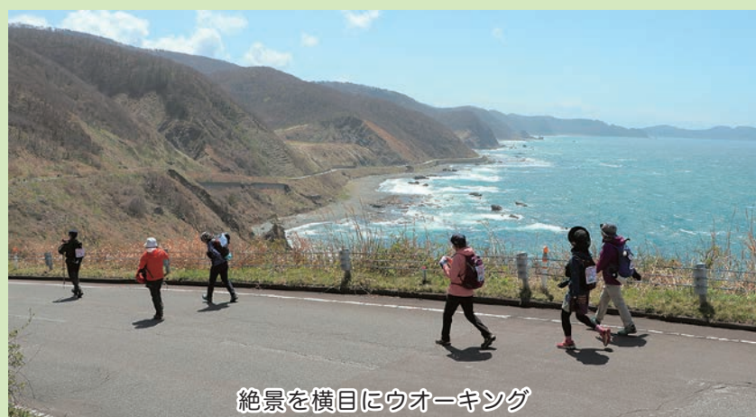
絶景を横目にウォーキング