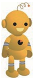
工業統計キャラクター・コワちゃん