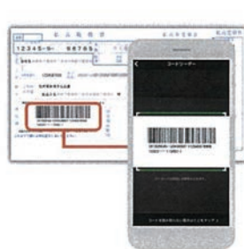
立ち上がったコードリーダーでお手元の請求書のバーコードを読み込む