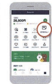
お財布マークの「ウォレット」タブ内「請求書支払い」をタップ