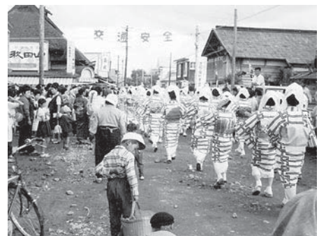
昭和40年 富野虫送り

馬や太刀振りなどの行列が村中を練り歩き、神官や獅子頭・大名行列・山車のほかに、傘袋といつて、和傘にいろいろな装飾品を吊り下げたものや、男女ペアの藁人形などが加わった時期もありました。