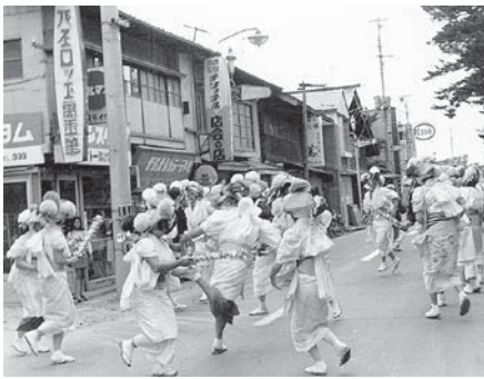
昭和49年 中里虫送り

なかでも、田植え終了後のサナブリ休みに行われる「虫送り」は最大の行事です。稲に付く害虫を追い払うという趣旨で、サナブリ太鼓を打ち鳴らしながら、藁で編んだ「虫」を先頭に、荒