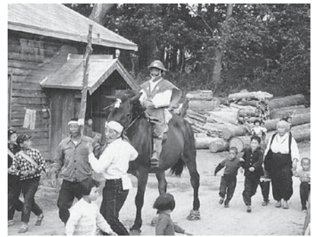
昭和36年 深郷田虫送り

中泊町中里地域においては、五穀豊穰を祈願する農耕儀礼が、正月行事を皮切りに一年を通じて行われてきました。