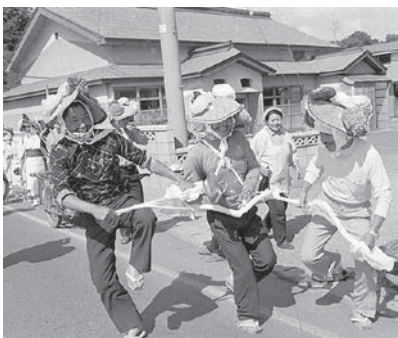
昭和51年 高根虫送り

残念ながら、春を彩るこれらの祭礼は、農耕社会の変質や少子高齢化に伴う担い手の不足等によって、目にする機会が少なくなってきました。