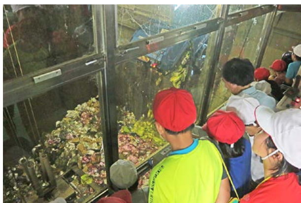
ごみ収集車搬入の様子

中里小学校4年生が9月14日(金)に、町一般廃棄物最終処分場と西部クリーンセンター(つがる市)を訪問しました。家庭から出たごみがどのように処分されているかを実際の施設で見て、様々な工程があることを学びました。ここでは、児童たちが学習した内容を見ていきます。