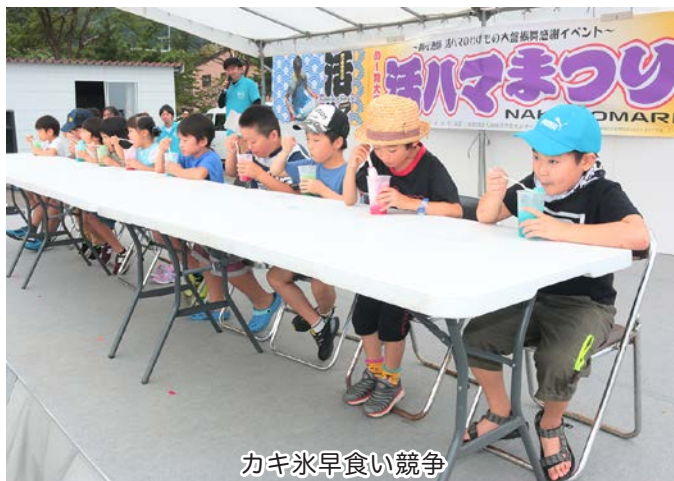
カキ氷早食い競争

この日は、北海道新幹線奥津軽いまべつ駅と津軽鉄道津軽中里駅を結ぶ二次交通バス「あらま号」を利用した「あらま号で行く小泊・市浦周遊活ハマまつりツアー」に参加した17人も訪れ、まつりを楽しみました。