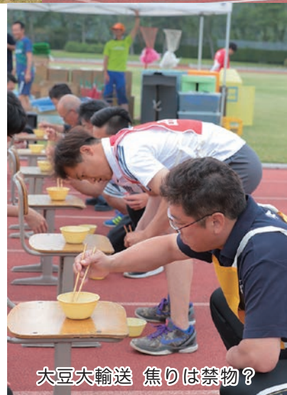
大豆大輸送 焦りは禁物?