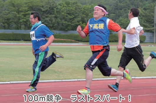
100m競争 ラストスパート!