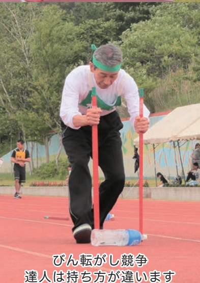
びん転がし競争 達人は持ち方が違います

年に一度の町民スポーツイベント「町民大運動会」が、6月24日(日)町運動公園で行われ、町内や合同チームなど15チームが参加し、優勝を目指して全42種目で競いました。今年は上位チームが接戦となり、大沢内地区が見事優勝しました。