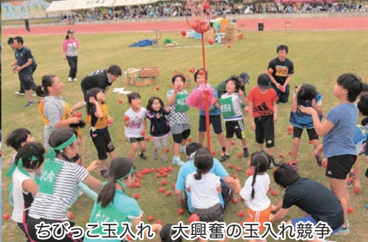
ちびっこ玉入れ 大興奮の玉入れ競争