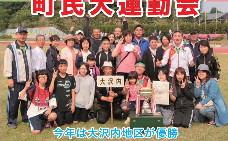
今年は大沢内地区が優勝