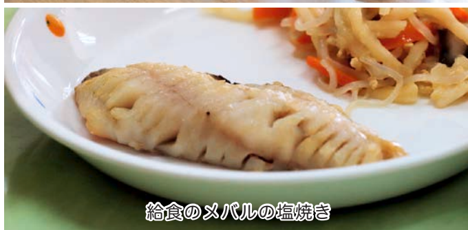
給食のメバルの塩焼き