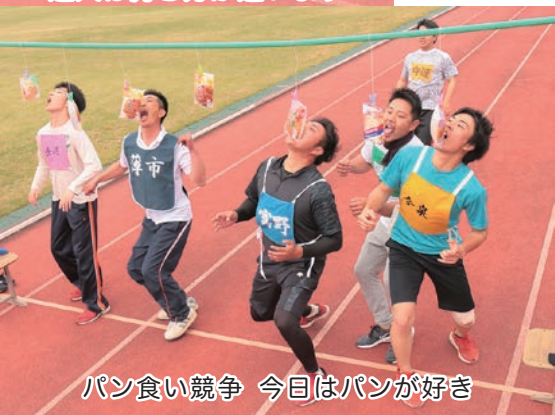
パン食い競争 今日はパンが好き