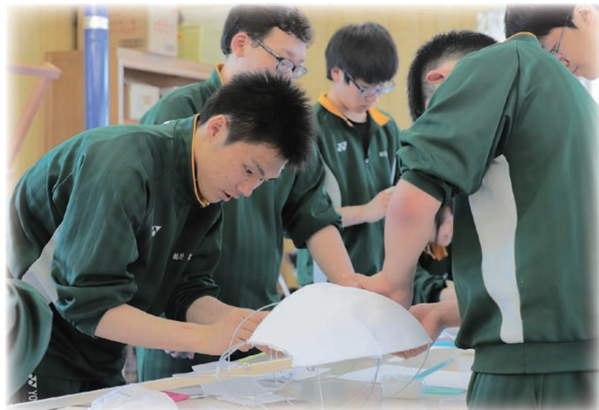
メバネブの紙貼り作業