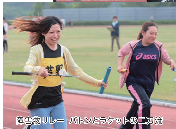
障害物リレー バトンとラケットの二刀流