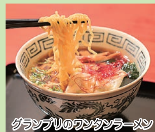
グランプリのワンタンラーメン

【お問合せ】中泊メバル料理グランプリ実行委員会 (役場水産商工観光課内) Tel. 57-2111