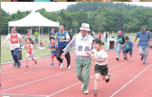
孫借り競争 意外と走れたんです