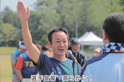
選手宣誓 高らかに!