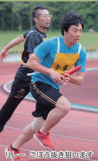
リレー ごぼう抜き狙います