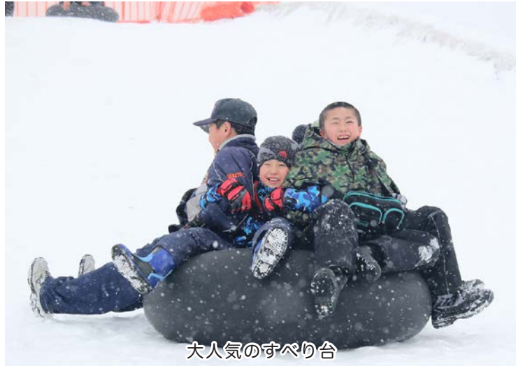
大人気のすべり台