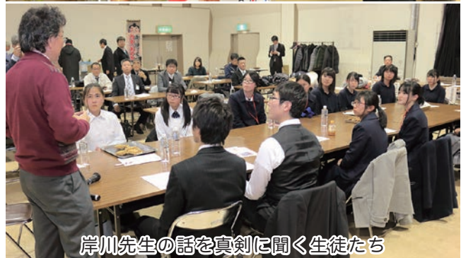
岸川先生の話真剣に聞く生徒たち