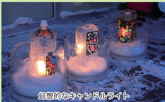
幻想的なキャンドルライト

外に出てからは、雪灯ろう作りに挑戦しました。バケツにパイプを入れ、その周りを雪で固めてからパイプを抜き、バケツから出すと雪灯ろうの完成です。何度か失敗して崩れたりもしましたが、コツをつかんだ子どもたちは、てきぱき雪灯ろうを作っていました。灯りが点けられると、ピュアの前には幻想的な風景が広がりました。子どもたちからは「すごくきれい。疲れたけど楽しかった」と声が上がっていました。