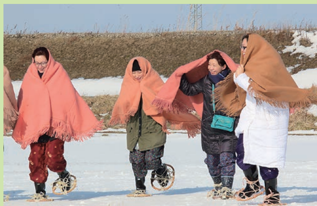
雪の上を楽しそうに歩くツアー客ら