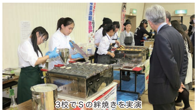
3校でSの絆焼きを実演

次に、私たちのメバ焼き！、鱈ヶ沢高校SBP研究会の力士くんおやき、ふかうらSBPのマグ口焼きの実演・試食交流を行いました。「おいしい。もう1個食べたい」という声が聞こえてきて嬉しかったです。