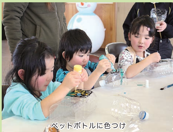
ペットボトルに色つけ