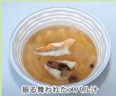
振る舞われたメバル汁

「飛ばされそうだった。雪国の人の強さを肌で感じる事ができ良い体験となった」と話していました。体験後は、熱々のメバル汁に舌鼓を打ち、冷え切った体を温めていました。