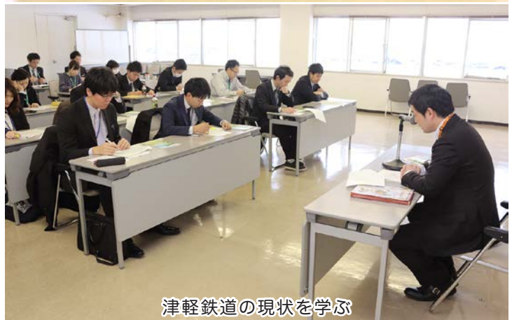
津軽鉄道の現状を学ぶ