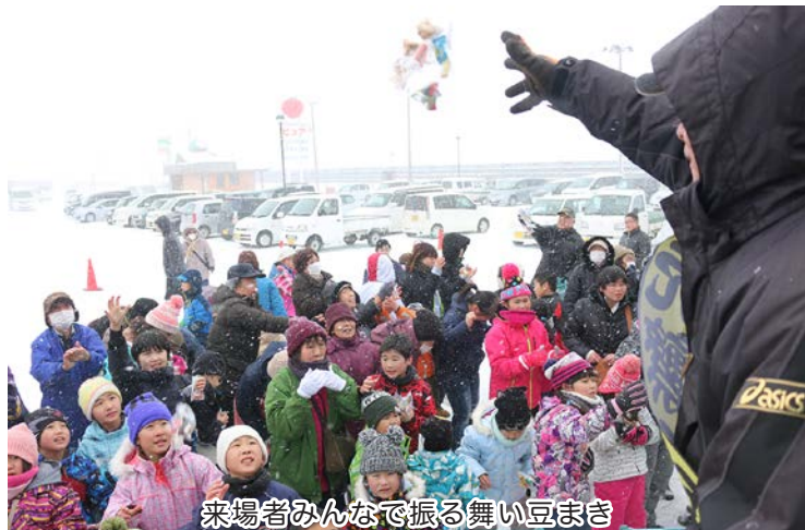
来場者みんなて振る舞い豆まき

また、恒例の大型すべり台が作られ、子どもたちには大人気でした。遊びにきた子どもたちは「すべり台が楽しかった。もっとすべりたい」と笑顔で話していました。