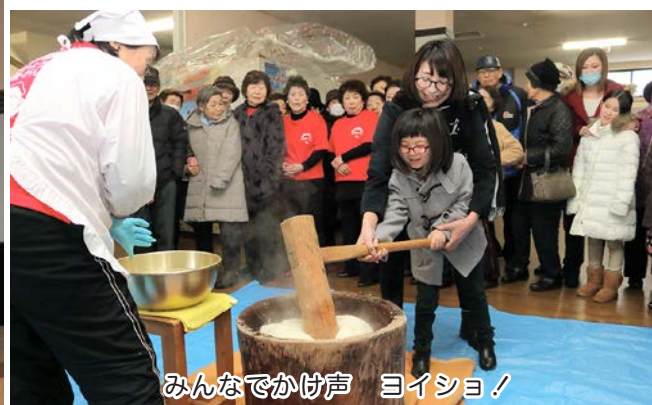
みんなでかけ声 ヨイショ！