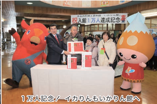
1万人記念！イカリんもいかりん館へ