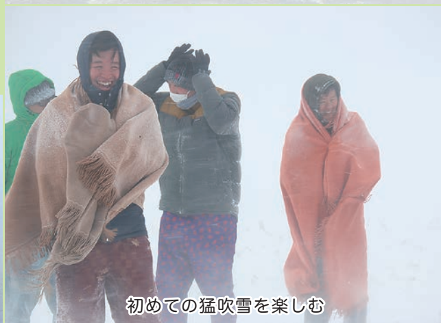
初めての猛吹雪を楽しむ