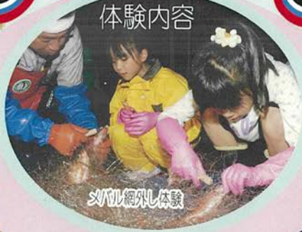
メバル網付し体験