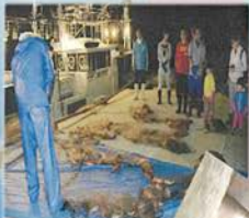
網から外す前 (水揚げ)