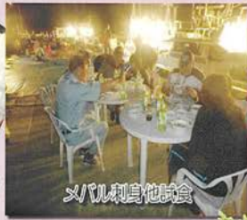
メバル刺身他試食