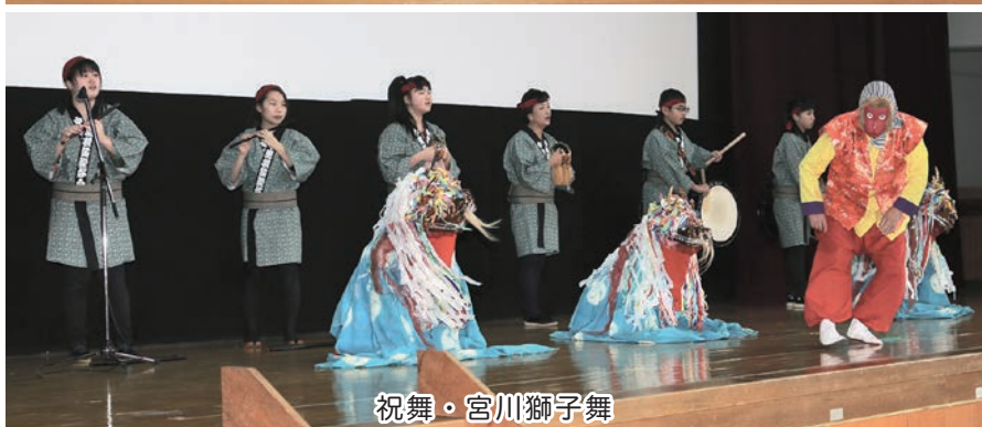
祝舞・宮川獅子舞