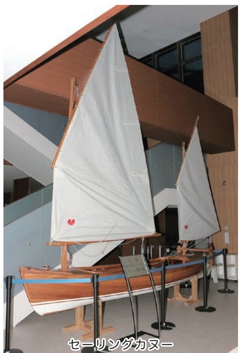
セーリングカヌー