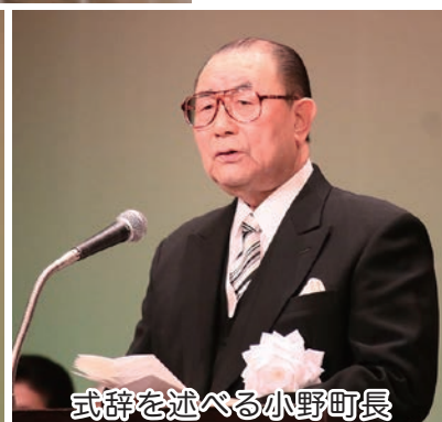
式辞を述べる小野町長