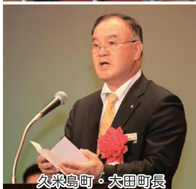
久米島町・大田町長