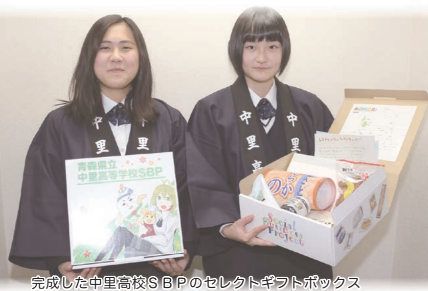
完成した中里高校SBPのセレクトギフトボックス

四月には熊本地震による甚大な災害、十月には旧中里町で親交があり昨年一月に当町議員団の行政視察研修で訪問した沖縄県久米島町が台風十八号の直撃を受け、農水産業関係で大きな被害に遭われ、当町からも見舞金を出しております。被災者の皆様には心よりお見舞い申し上げますとともに、一日も早い復興を願っております。 また、嬉しいニュースとしては、八月のリオデジャネイロオリンピックで日本のメダル数が日本史上最多の四十一個となり、日本人選手の健闘が多くの国民に