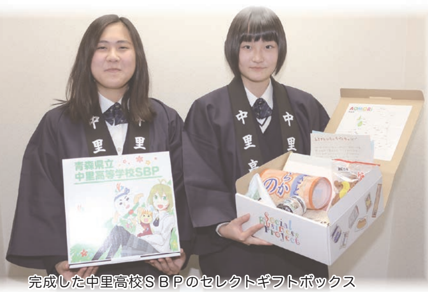
完成した中里高校SBPのセレクトギフトボックス

新年あけましておめでとうございます。町民の皆様におかれましては、健やかに平成二十九年の新春をお迎えのことと心からお慶び申し上げます。また、日頃より町議会活動に対し、格別のご理解とご協力を賜り厚くお礼申し上げます。年頭にあたり町議会を代表しまして、謹んで新年のご挨拶を申し上げます。 昨年を振り返りますと、三月には北海道新幹線が開業し津軽半島の観光振興にも大きな影響を与えた年だと感じております。それに伴い津軽中里駅から奥津軽いまべつ駅間のバス運行も始まり、観光客がより広域的な観光ルートを選択できるようにになりました。しかし、その一方でバスの利用率が低く今後の検討課題として、取り組んでいかなければならないと感じております。 四月には熊本地震による甚大な災害、十月には旧中里町で親交があり昨年一月に当町議員団の行政視察研修で訪問した沖縄県久米島町が台風十八号の直撃を受け、農水産業関係で大きな被害に遭われ、当町からも見舞金を出しております。被災者の皆様には心よりお見舞い申し上げますとともに、一日も早い復興を願っております。 また、嬉しいニュースとしては、八月のリオデジャネイロオリンピックで日本のメダル数が日本史上最多の四十一個となり、日本人選手の健闘が多くの国民に