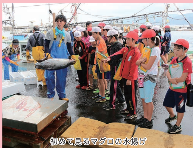
初めて見るマグロの水揚げ

次に、水産観光課職員から小泊地域で水揚げされる魚の種類、漁法などを学びました。児童らは、真剣な表情で説明されたことをノートに書き込んでいました。最後に小泊神明宮前で磯焼け対策として有機微生物入りの泥団子の投入を体験しました。子どもたちは「小さいマグロだったけど思っていたよりも重かった。資源を大切に、またたくさん魚が獲れるようになったらいい」と話していました。