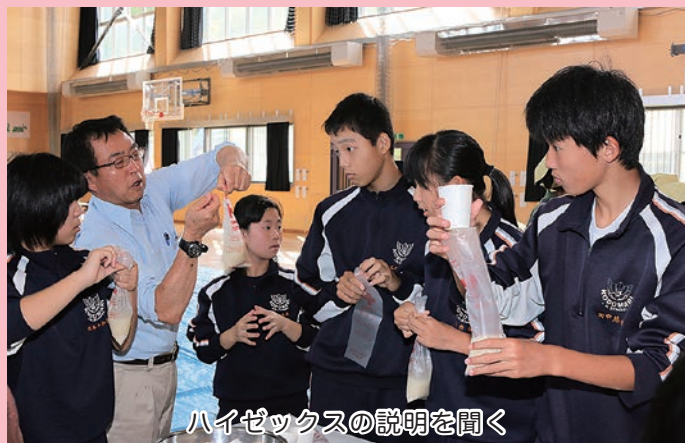
ハイゼックスの説明を聞く

試食後は、救急法の講習となり、専用の人形を使ったAEDの使用法や三角巾をつかった応急処置を学びました。担当した講師は「AEDはもうどこにでもあるものなので、しっかりと使用法を覚え、いざというときに使えるようになってほしい」と話していました。