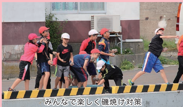
みんなで楽しく磯焼け対策