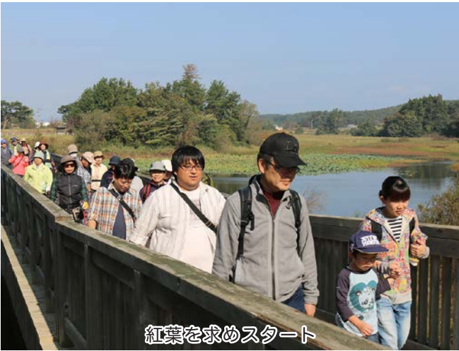
紅葉を求めスタート

昼食後は、新米や海産物、地元野菜のセットなどがあたる抽選会が行われ、自分の番号が呼ばれると笑顔で手をあげていました。