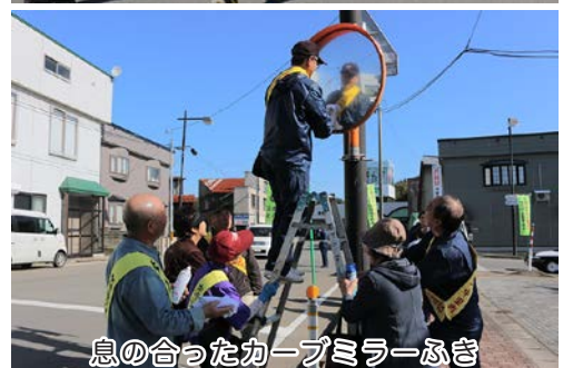
息の合ったカーブミラーふき