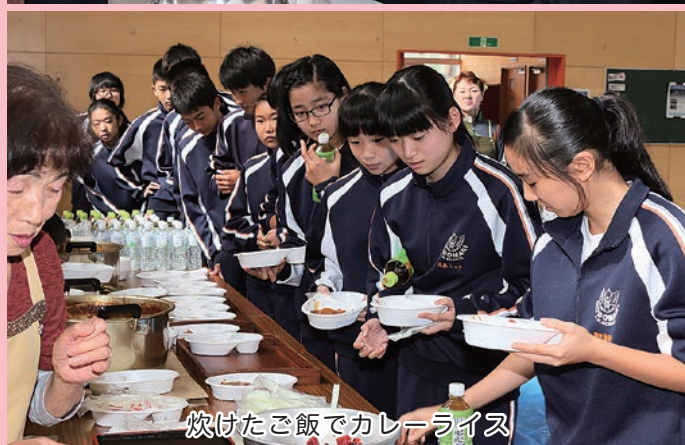
炊けたご飯でカレーライス