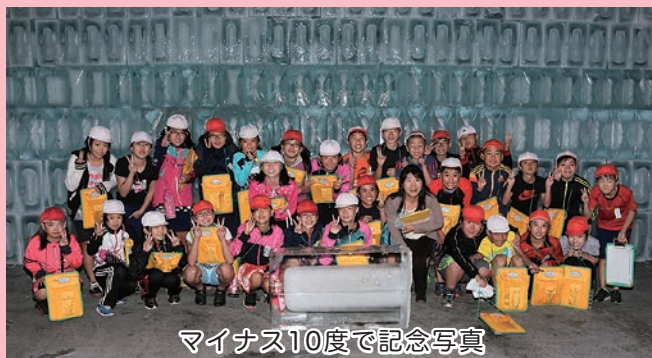
マイナス10度で記念写真