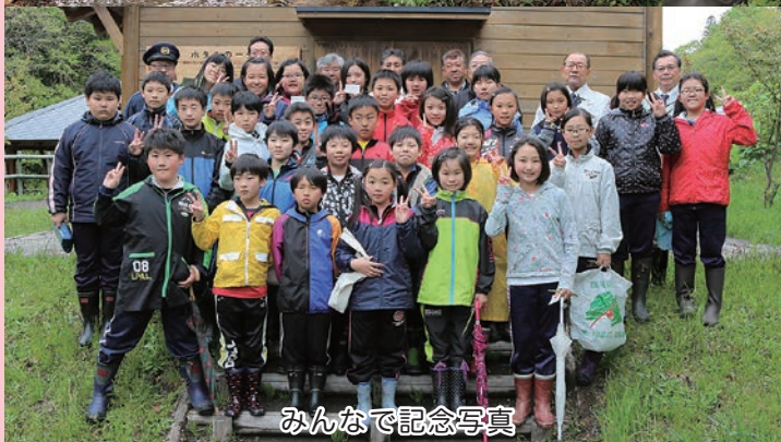
みんなで記念写真