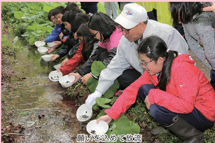
願いを込めて放流