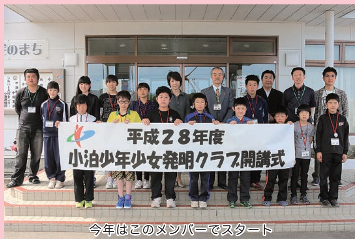
今年はこのメンバーでスタート

やちりめん布を貼り付け、スズやラインストーンなどで飾り付けをし、オリジナルのキーホルダーを作りました。子どもたちは「シジミに和紙や布を貼り付けるのが大変だったけど、きれいにできたので嬉しい。もう1つ作って友達にもあげたい」と話していました。