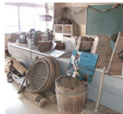
◆小泊地区の漁撈具大募集！ 博物館所蔵の山樵具は、「津軽の林業用具」として国登録有形文化財になっていますが、このほど小泊地区の漁撈具についても、国登録を目指すことになりました。つきましては、蔵や倉庫などで眠っている昔の漁撈具を大募集いたします。寄贈いただける人は、博物館までご連絡くださいませ。

5月下旬、「昔の暮らし」をテーマに中里小学校6年生が来館しました。中里地域の衣・食・住の変遷について学芸員の話に耳を傾けた後、縄文時代の深郷田遺跡、平安時代の中里城遺跡、安藤氏が遺した中世文化財、江戸時代の中里村の様子などが展示室を巡りながら、自分たちが暮らす中里地域のあゆみについて学習しました。