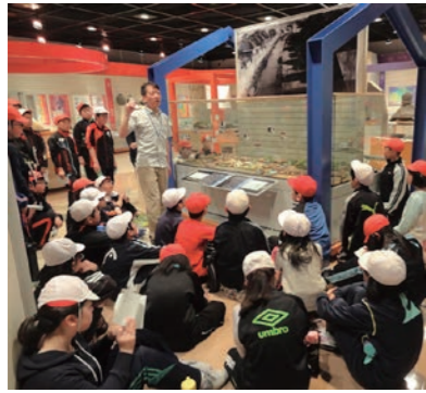
◆中里小6年「郷土・まちづくり学習事業」！