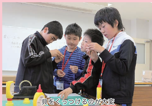
貝をくっつけるのが大変