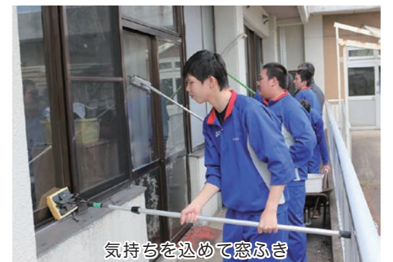
気持ちを込めて窓ふき

午前中、1・2年生は町運動公園の陸上競技場で緑地にたまったゴミやトラック脇の側溝内の落ち葉や小枝などを片づけました。午後は静和園で窓ふきや車イスふき、利用者の屋外の散歩を手伝いました。3年生26人は、同校近くの内湯療護園で、施設の窓ふきや車イスなどの介護用品のふき掃除で奉仕しました。