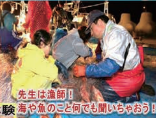
先生は漁師! 海や魚のこと何でも聞いちゃおう!