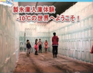
製氷庫入庫体験 -10℃の世界へようこそ!