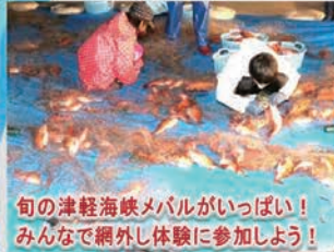
旬の津軽海峡メバルがいっぱい! みんなで網外し体験に参加しよう!