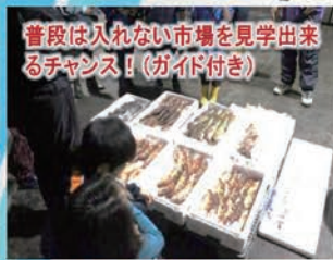
普段は入れない市場を見学出来るチャンス!(ガイド付き)