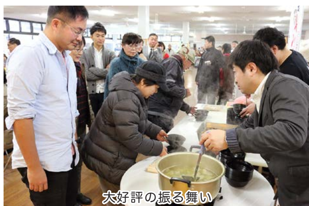
大好評の振る舞い

新幹線対策やサポーターズクラブの活動報告の後、中泊メバル料理推進協議会からメバルの煮付けとじゃっば汁の振る舞いが行われました。とても好評でおかわりする人もたくさんいました。