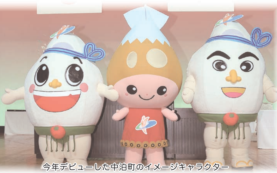
今年デビューした中泊町のイメージキャラクター

明けましておめでとうございます。今年も町民の皆様方と共に、新年を迎えることができましたことを心よりお慶び申し上げます。