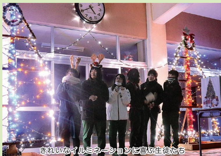
きれいなイルミネーションに喜ぶ生徒たち