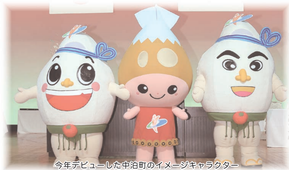
今年デビューした中泊町のイメージキャラクター

明けましておめでとうございます。今年も町民の皆様と共に、新年を迎えることができましたことを心よりお慶び申し上げます。 ご承知のとおり、中泊町は昨年三月に合併十周年を迎えることができました。当初は、飛び地合併を心配する声がありましたが、充実した行政サービスを提供するため、地域連絡バスの運行、防災行政用無線の整備、地域交流型イベントの開催など多くの施策に取り組み、大過なく十年という節目の年を迎えることができました。これも偏に町民の暖かいご協力と多大なるご尽力の賜であり、厚く御礼申し上げます。 さて昨年を振り返りますと様々な出来事がありました。町のイメージキャラクター「米ケル」「米ケルJr」「イカリん」のデビュー、地域の課題解決に向けた明の星短期大学との官学連携協定の締結、以前交流がありました沖縄県久米島町との交流再開、そして地元産の「海峡メバル」と「つがるロマン」を使用した「中泊メバル膳」のデビューは、想定を越える速さで売上目標一万食を達成し、中泊町の知名度向