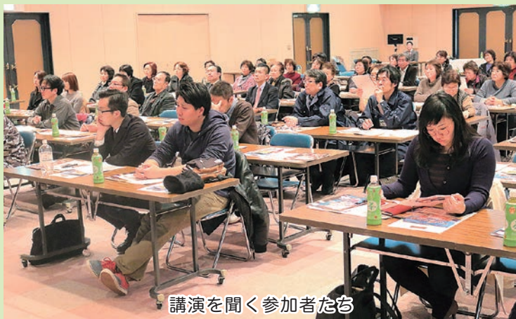
講演を聞く参加者たち

その後、フォーラムに参加した活ハマクラブといいなかどまり会の会員らが交流し、これからの中泊町の活性化に向けて協力できることを話し合いました。