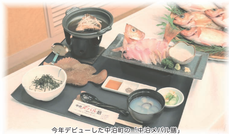
今年デビューした中泊町の「中泊メバル膳」

新年あけましておめでとうございます。町民の皆様におかれましては、輝かしい平成二十八年の新春を晴れやかに迎えのことと心からお慶び申し上げます。年頭にあたり町議会を代表して、町民の皆様へ新年のごあいさつを申し上げます。 旧年中は、町議会活動に対しまして格別のご理解とご協力を賜り厚くお礼申し上げます。 また、私ごとではありますが、昨年一月の議会臨時会において、議員各位のご推挙により議長に就任いたしました。新春を迎え中泊町のさらなる発展のため、皆様とともに知恵を出し合いながら鋭意努力してまいりたいと決意を新たにしております。 さて、日本経済においては、昨年大幅な原油安・円安の恩恵によって高成長になることが期待されましたが、春から夏場にかけて景気が低迷するなど思ったほどの景気回復には至らないよう、今後政府の成長戦略（アベノミクス）による経済政策に期待するとともに、町議会としても今後の動向を注視し、本年がより良い年であることを願うものです。 町議会では、昨年の十一月に知事を含む行政懇談会において、「第二津軽大橋