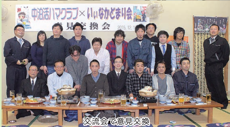
交流会で意見交換