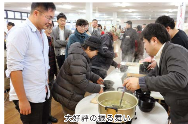
大好評の振る舞い

新幹線対策やサポーターズクラブの活動報告の後、中泊メバル料理推進協議会からメバルの煮付けとじゃっば汁の振る舞いが行われました。とても好評でおかわりする人もたくさんいました。