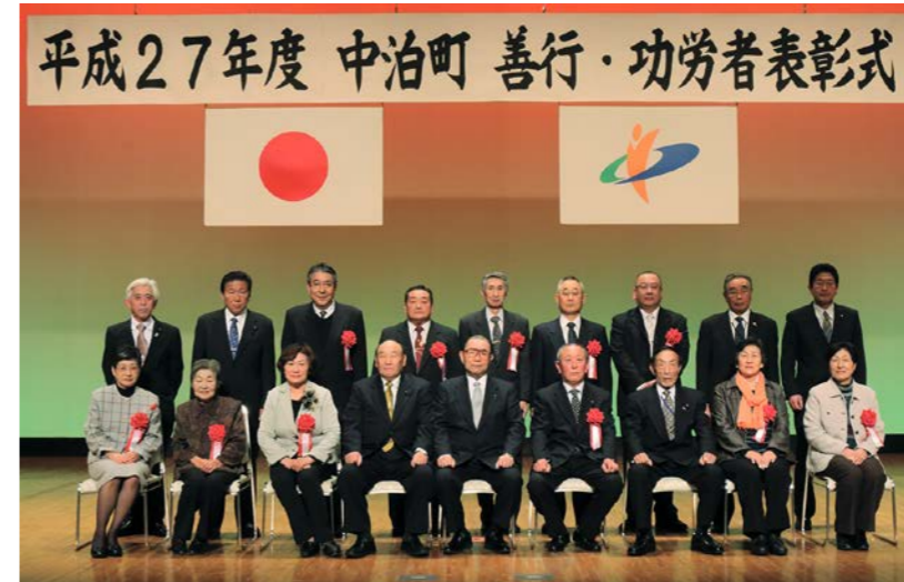
平成27年度 中泊町 善行・功労者表彰式

公共の福祉の増進に貢献した人や町民の模範となるべき人を表彰する町善行・功労者表彰式が、11月26日(木)パルナスで行われました。