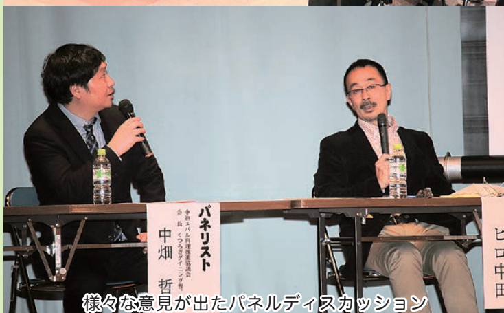
様々な意見が出たパネルディスカッション