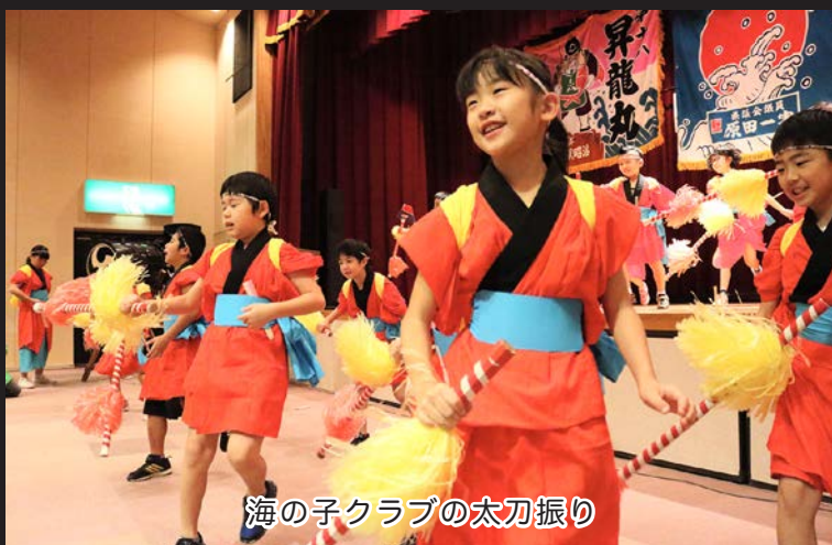
海の子クラブの太刀振り