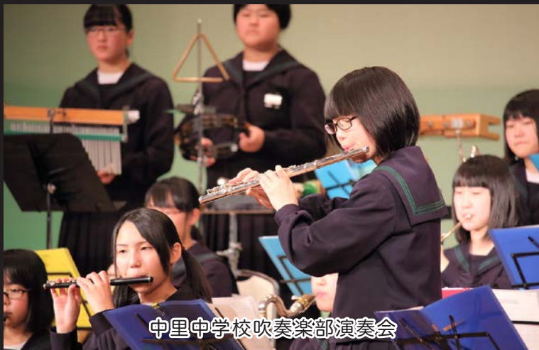
中里中学校吹奏楽部演奏会