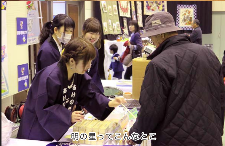
明の星ってこんなとこ