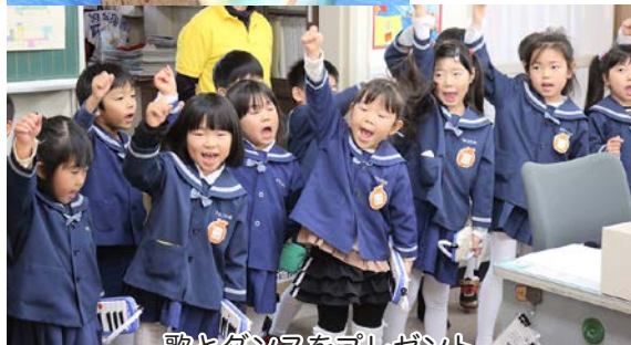
歌とダンスをプレゼント