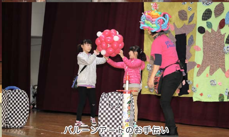
バルーンアートのお手伝い