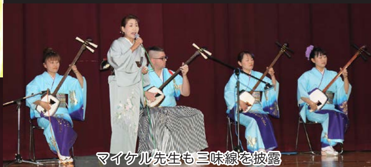
マイケル先生も三味線を披露

また、明の星短期大学の学生らが「明の星ってどんなとこ？」と題したコーナーを設け、来場者に同短期大学の魅力や特色を説明していました。作品展示コーナーでは、日頃の成果を披露する公民館教室の作品展示、保育所・幼稚園・小中学校の作品、一般募集作品、特産品展示が行われ、家族や友人たちの展示物を探すなど町民文化祭を楽しみました。