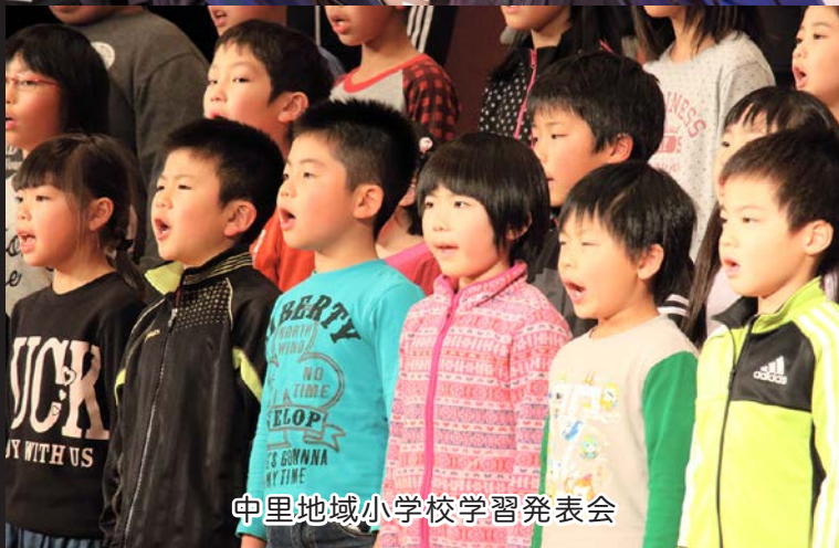
中里地域小学校学習発表会