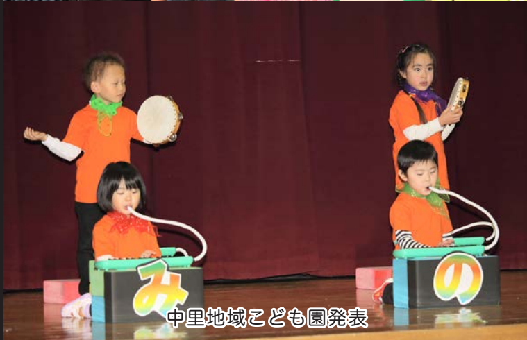
中里地域こども園発表