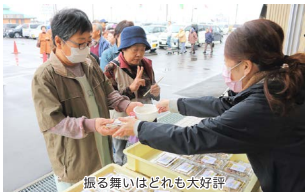
振る舞いはどれも大好評