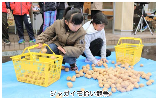
ジャガイモ拾い競争

続いて小野町長が「みなさん来場ありがとうございます。今日は3種類のふるまいやゲームなどたくさんのイベントがあります。最後まで