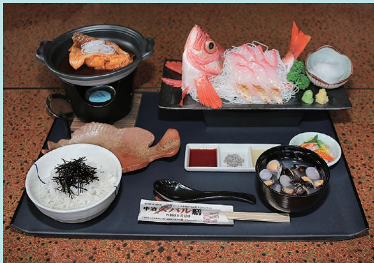
本物そっくりのサンプル

サンプルは2セット作られ、役場本庁の入口に1セット設置し、もう1セットは町内外のイベントで活用するそうです。