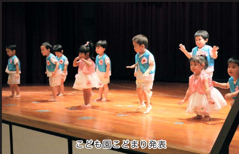
こども園こどまり発表

一方、屋外では恒例のマグロ解体即売会、早食い大会、ビンゴ大会、カップラーメンすくいのにぎわいました。