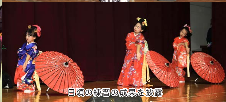
日頃の練習の成果を披露