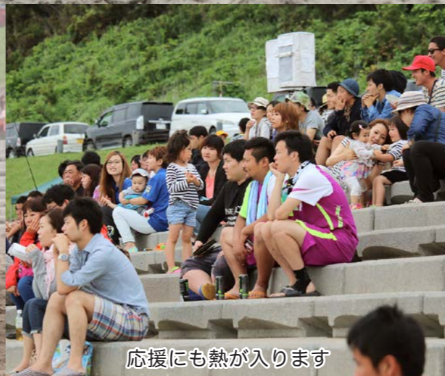
応援にも熱が入ります