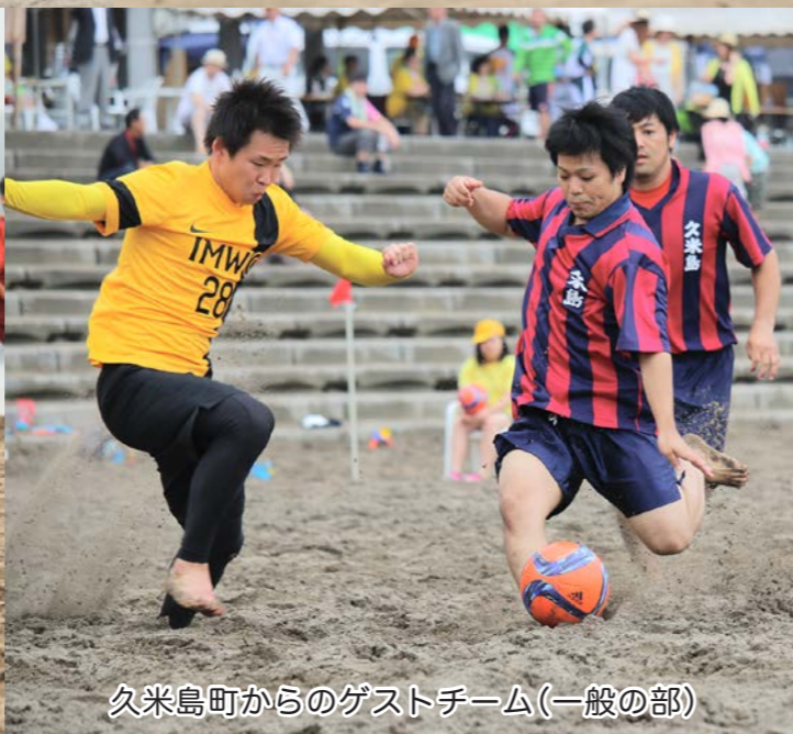
久米島町からのゲストチーム(一般の部)