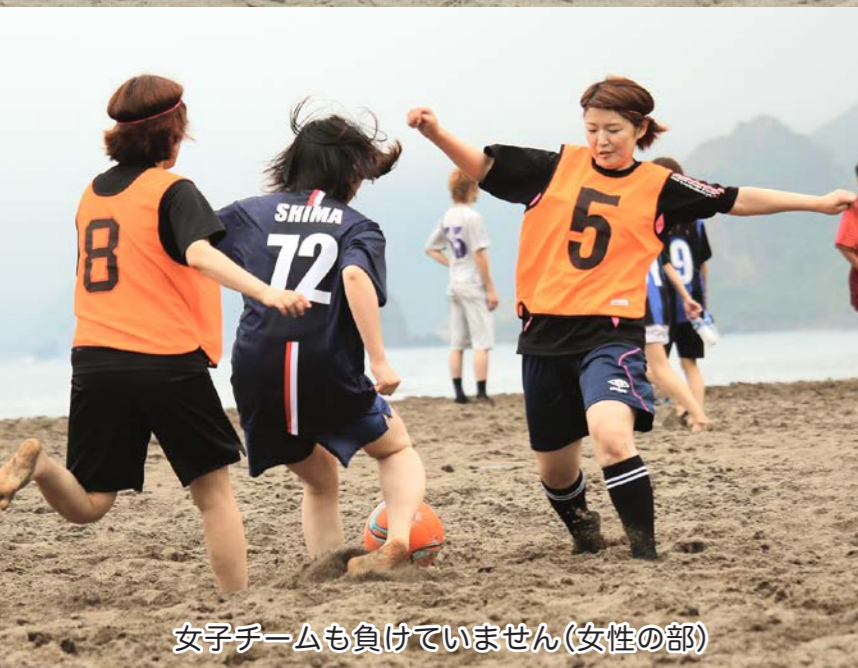
女子チームも負けていません(女性の部)