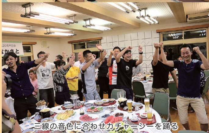
三線の音色に合わせカチャーシーを踊る