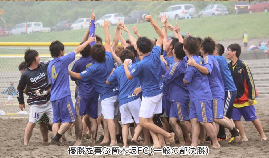
優勝を喜ぶ筒木坂FC(一般の部決勝)