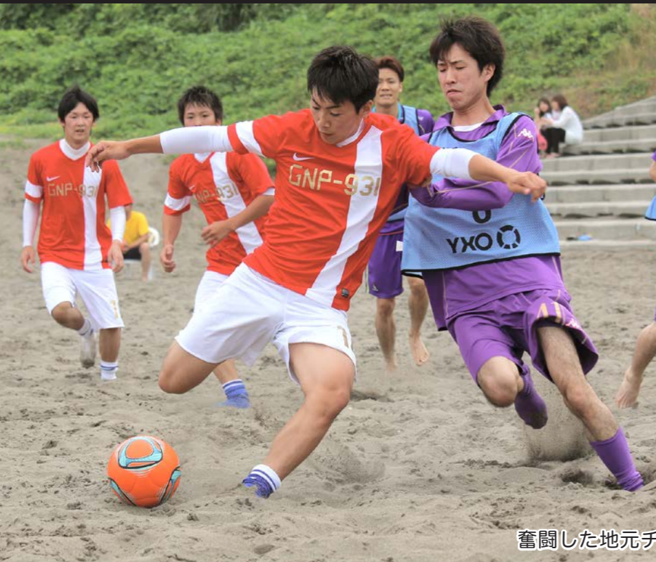
奮闘した地元チーム(一般の部)