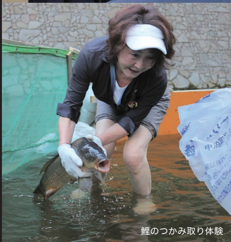
鯉のつかみ取り体験