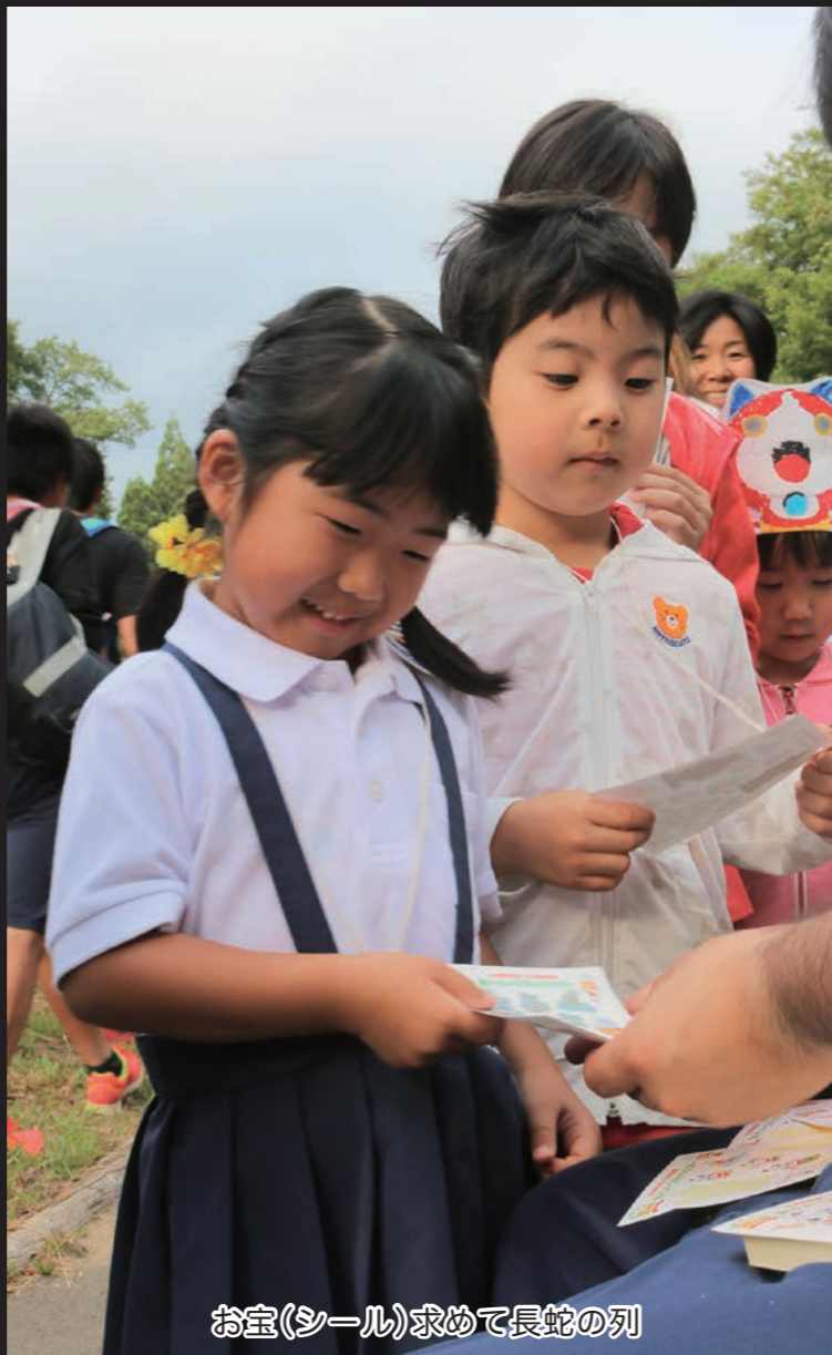
お宝(シール)求めて長蛇の列