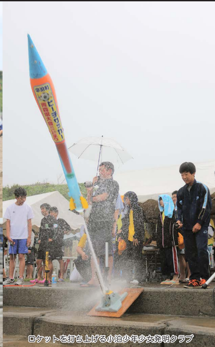
ロケットを打ち上げる小泊少年少女発明クラブ