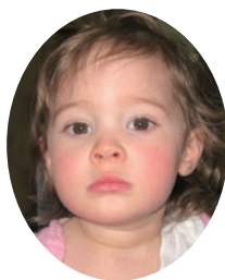
ハーウィック アイリ HOWICK AIRI アレキサンドラ ちゃん (宮野沢)