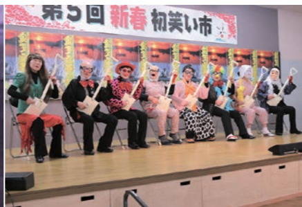
仮装してスコップ三味線