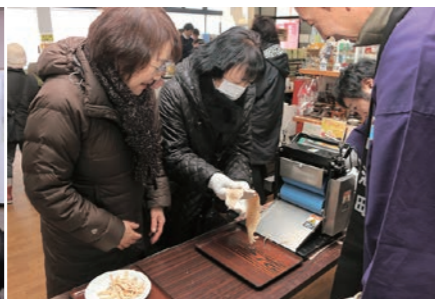
のしイカづくり体験