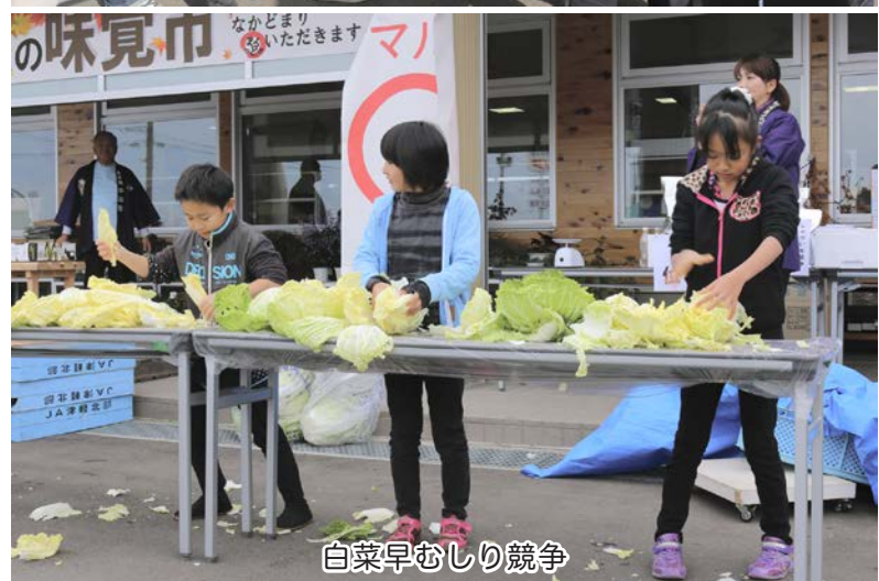
白菜早むしり競争