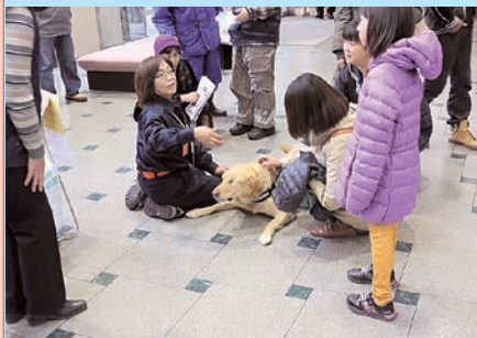
救助犬ふれあい体験

恒例のもったいない町民大会が、11月16日(日)パルナスで開催されました。今回のテーマは「防災」。「あなたの大切な人を守ること」と題して、ステージや野外での催しが行われました。