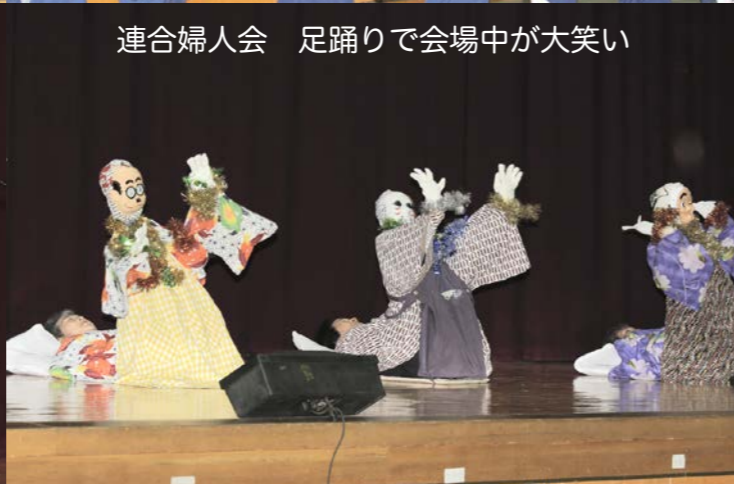
連合婦人会 足踊りで会場中が大笑い