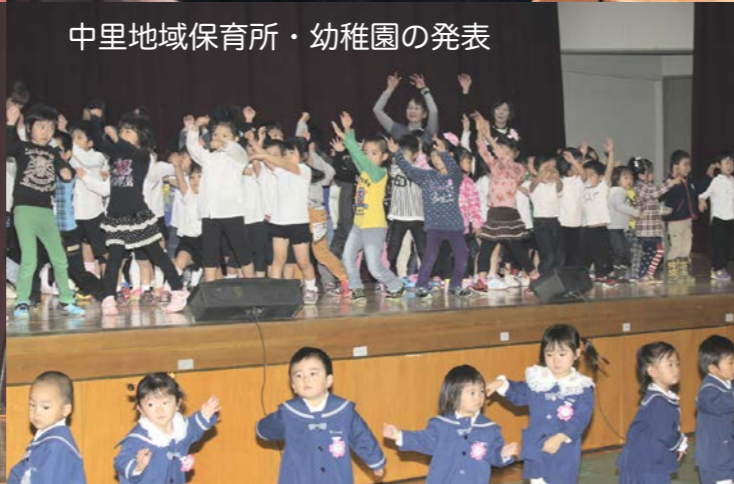
中里地域保育所・幼稚園の発表