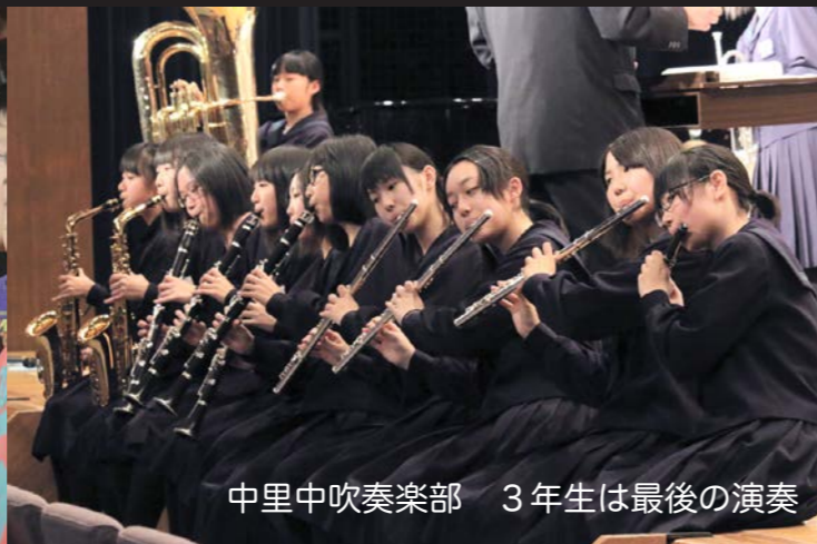
中里中吹奏楽部 3年生は最後の演奏