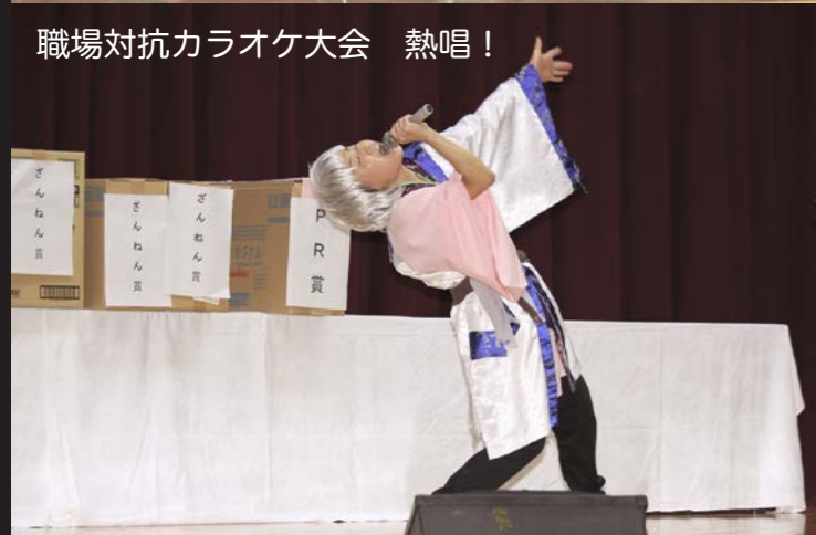
職場対抗カラオケ大会 熱唱!