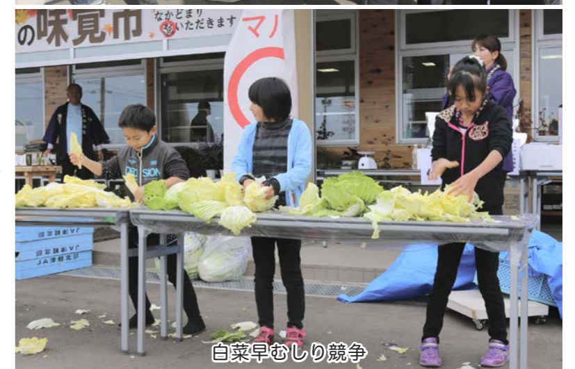
白菜早むしり競争