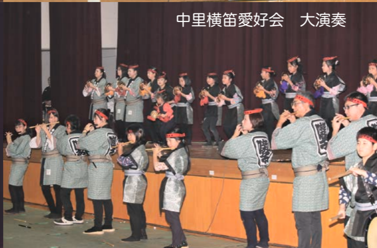
中里横笛愛好会 大演奏

■小泊会場 10月25、26日、日本海漁火センター 発明クラブの子どもチャレンジコーナーでは、馬ロボットを走らせ、競馬のように1位を予想するダービーが開かれました。見事予想的中した子どもには、賞品がプレゼントされました。