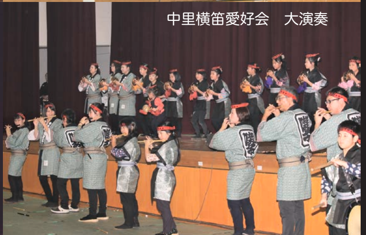
中里横笛愛好会 大演奏