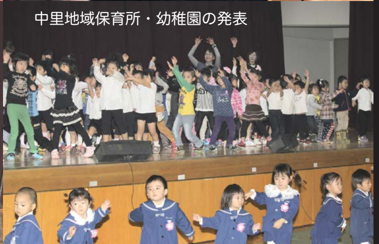
中里地域保育所・幼稚園の発表