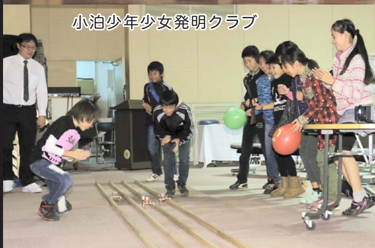
小泊少年少女発明クラブ