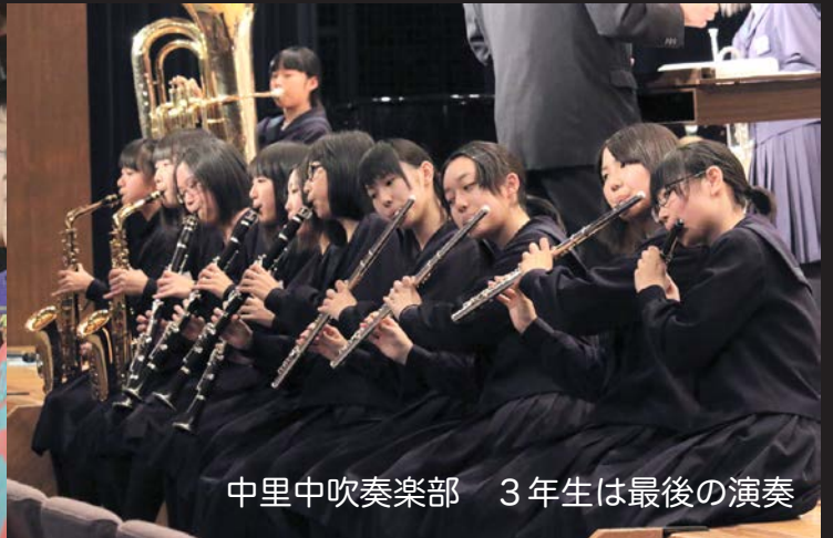
中里中吹奏楽部 3年生は最後の演奏