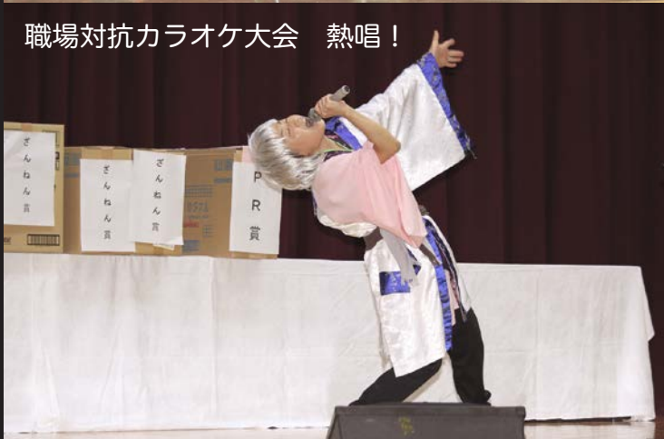
職場対抗カラオケ大会 熱唱！