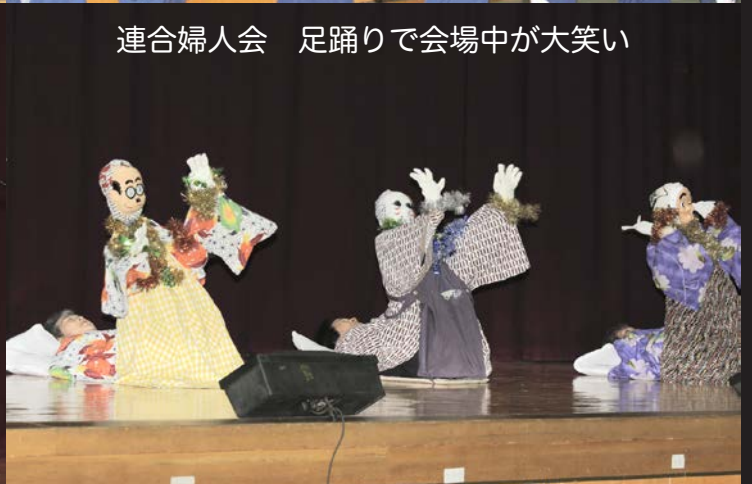
連合婦人会 足踊りで会場中が大笑い