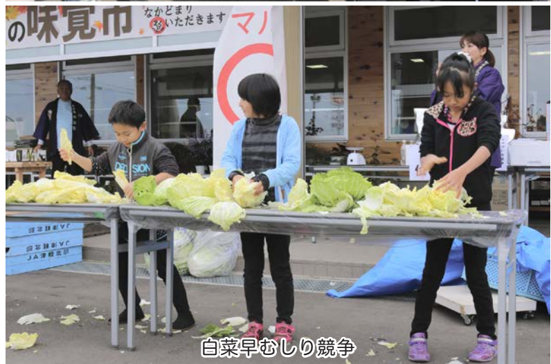
白菜早むしり競争