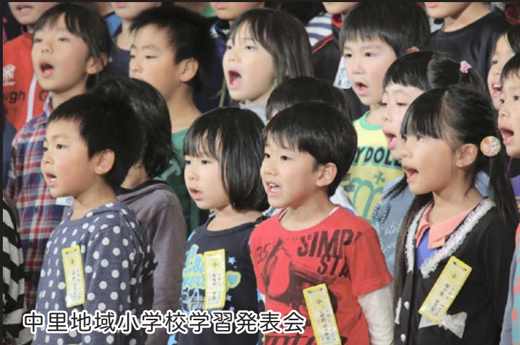
中里地域小学校学習発表会