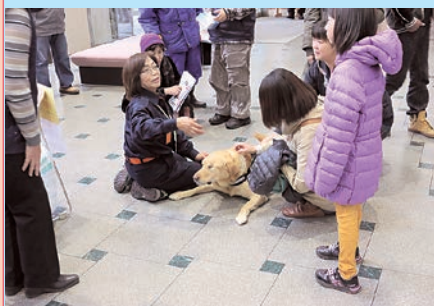
救助犬ふれあい体験

恒例のもったいない町民大会が、11月16日(日)パルナスで開催されました。今回のテーマは「防災」。「あなたの大切な人を守ること」と題して、ステージや野外での催しが行われました。