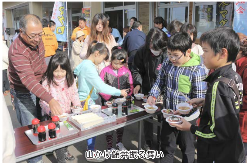
山かけ鮪丼振る舞い

また、会場では白菜早むしり競争、ジャガイモ拾い競争、りんご食べて減らして競争、ご当地〇×ウルトラクイズなど、ユニークな催しも行われ、参加者は楽しんでいました。