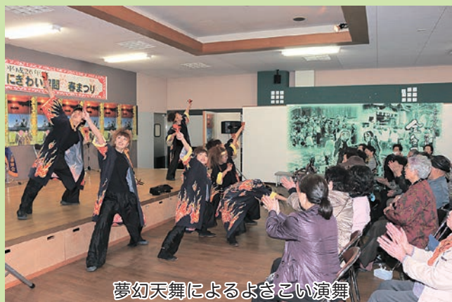
夢幻天舞によるよさこい演舞