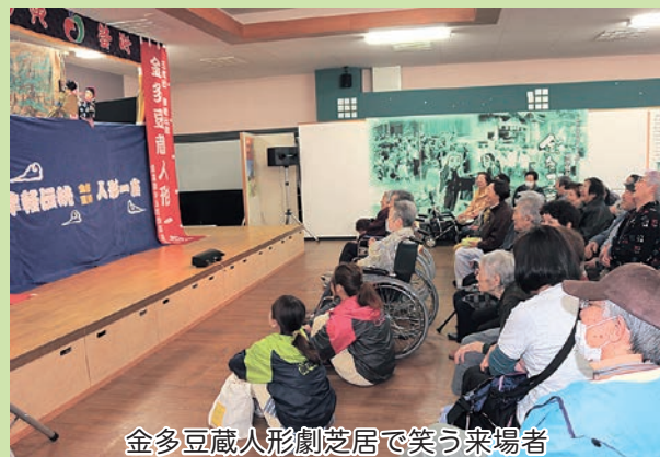
金多豆蔵人形劇芝居で笑う来場者