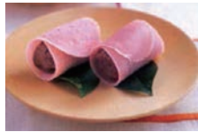
1人分:162kcal、塩分:0.1g カルシウム96mg