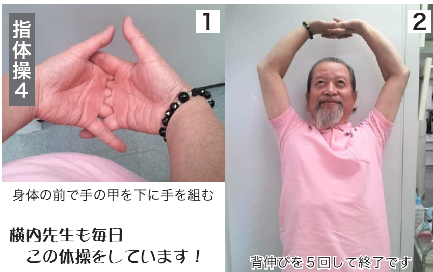
1 身体の前で手の甲を下に手を組む