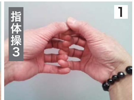
1 親指で上から10回繰り返し押し