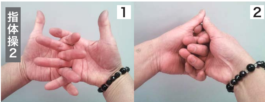
1 指を身体側に向け交差に組む