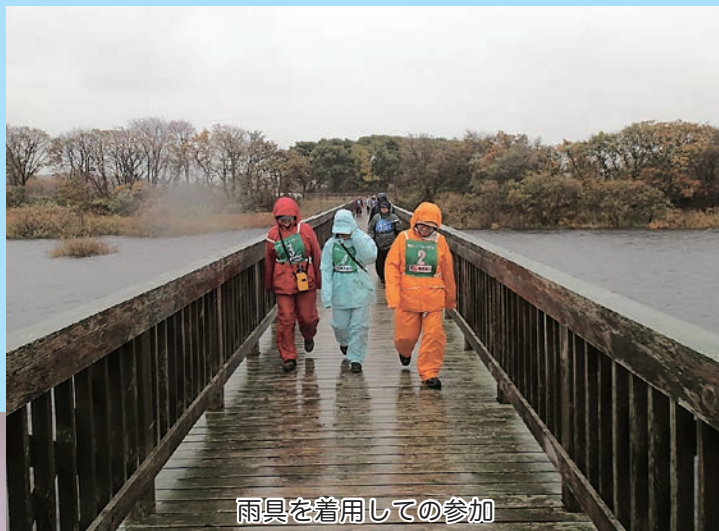
雨具を着用しての参加

ウォークは通常雨天決行であり、この日も大雨、強風、低温と厳しいコンディションとなりましたが、参加者142人は、森林やため池周辺を3時間程度かけてそれぞれのペースでウォーキングを楽しみました。