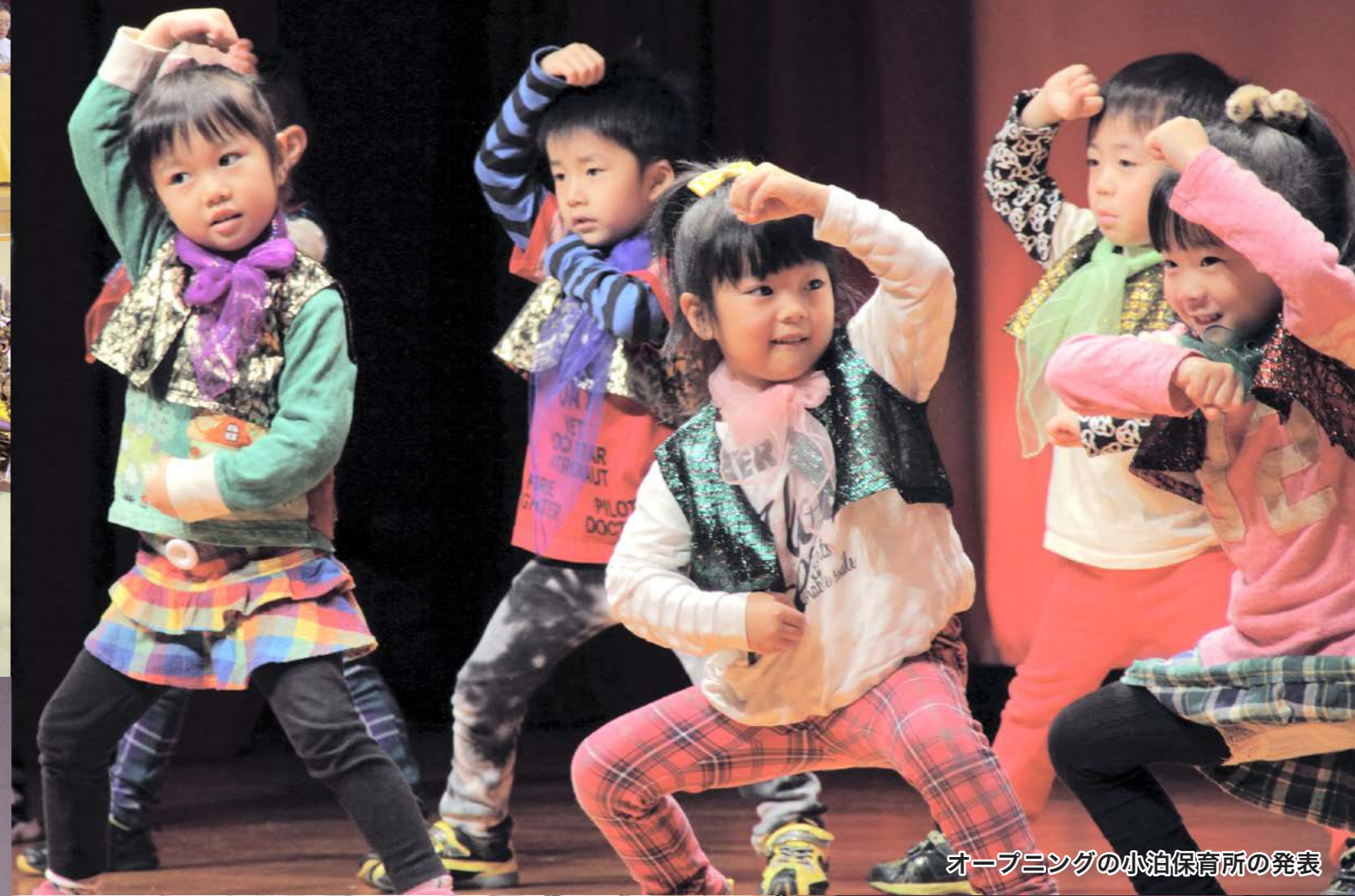
オープニングの小泊保育所の発表

また、作品展示コーナーでは、公民館教室の作品展示、保育所・幼稚園・小中学校の作品、一般募集作品、特産品展示が行われ、家族や友人たちの展示物を探すなど町民文化祭を楽しみました。