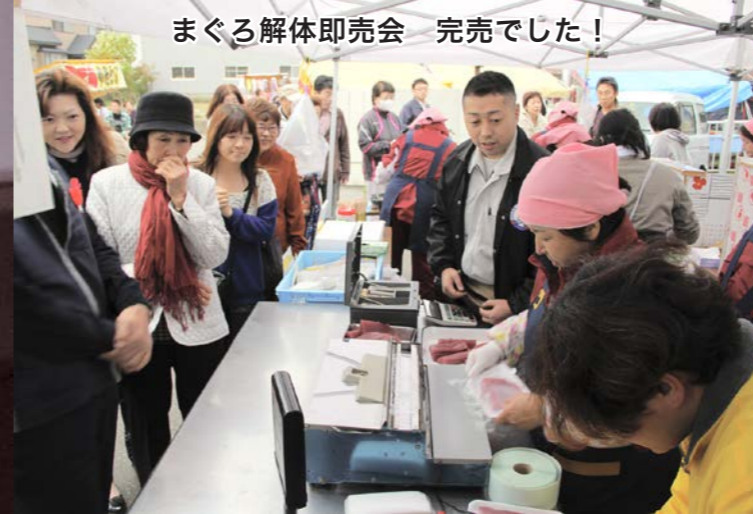
まぐろ解体即売会 完売でした！