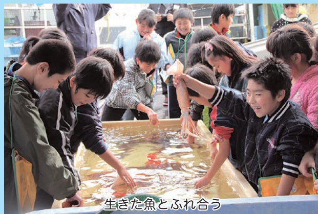
生きた魚とふれ合う

魚とのふれあい体験からスタートした勉強会。児童たちは地元産の活イカ・アワビ・サザエなどをつかんだり、触ったりしながら小泊地域で獲れる魚貝類について勉強しました。