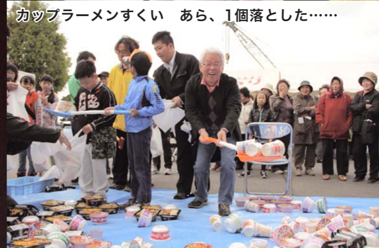
カップラーメンすくい あら、1個落とした……