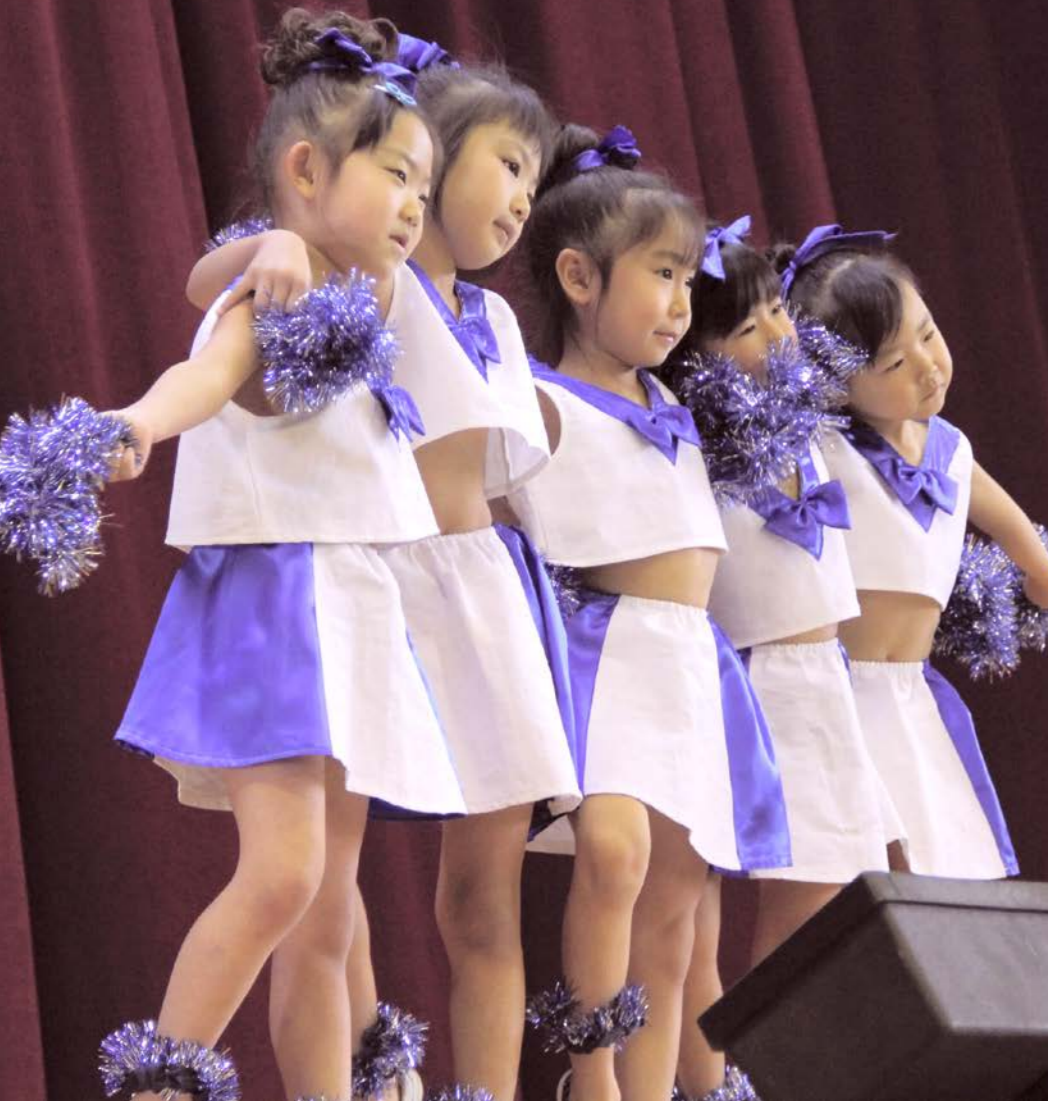
中里地域保育所・幼稚園の発表 かわいいでしょ！

小泊会場では、10月26～27日、日本海漁火センターで小泊保育所の発表、婦人会や芸能団体による発表、文化作品などの展示が行われました。一方、屋外では恒例のマグロ解体即売会、ビンゴ大会などが行われ、中でも今年初のカップラーメンすくい人気を集め、参加費100円で1回だけすくうルールに最大5個をゲットする参加者もいました。