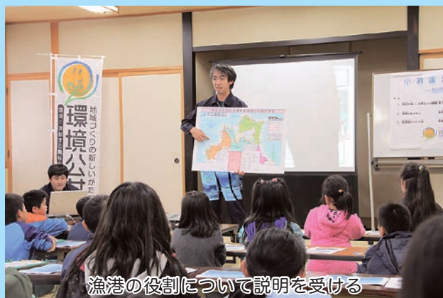
漁港の役割について説明を受ける

続いて漁港の役割について説明を受け、漁船の基地、仕事をしやすくしたり、避難など漁業者の生活をよりよくするために作られていることを学びました。