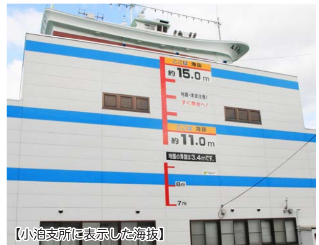
【小泊支所に表示した海拔】

→ 津波避難の目安。中里地域でも岩木川のはん濫などに備えて設置した。(注:3月号でくわしく掲載予定)