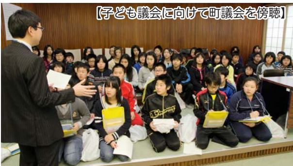
【子ども議会に向けて町議会を傍聴】