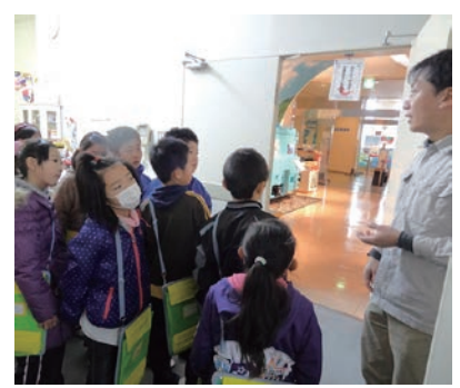
管理棟を見学する武田小3年生