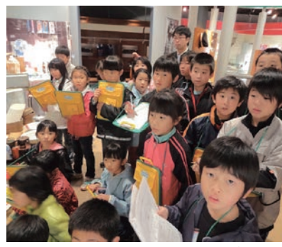
道具の変化を調べる小泊小3年生

◆小泊小・武田小3年生来館！ このほど、町内の小学校3年生が相次いで来館しました。