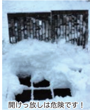
開けっ放しは危険です！

深郷田・下高根・薄市・小泊地区の融雪溝ご利用の皆さまへ 融雪溝のフタを開けっ放しにするととても危険です。除雪作業に支障があるばかりでなく、歩行者の転落事故につながる恐れがあります。 事故やフタの破損防止のため、雪捨てが終わったらフタは必ず閉めましょう。