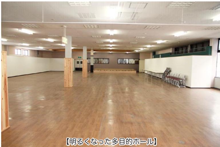
【明るくなった多目的ホール】

4月8日(日)、新たに生まれ変わった津軽中里駅で「駅ナカにぎわい空間出発式」が行われ、大勢の来場客がさまざまなイベント、買い物を楽しみました。この日行われたのは、地元団体による大直売会のほか、オープニングを飾った中里中吹奏楽部の演奏、餅つき体験とふるまい鍋、ミニ電車の乗車体験、金多豆蔵人形芝居の無料公演、新たに整備された金多豆蔵シアターの上演、健康ダンス「べえ子ちゃん」のショー、よさこいグループ「夢幻天舞」の迫力あるダンスなど、盛りだくさんの内容。息もつかせぬ展開に、来場客は一日楽しく過ごしました。