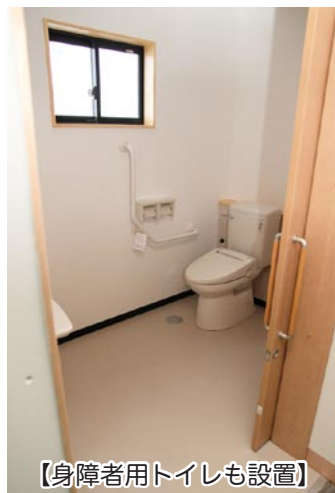
【身障者用トイレも設置】

このスペースは、普段から気軽にふらりと立ち寄れる空間を目指して、今後いろいろなことを展開していく予定で、各種発表会のステージに使ったり、活動の成果を展示するスペースとしても活用できるとのこと。くわしくは、町水産観光課(☎64-2111)までお問合せください。