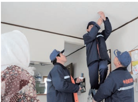
【ボランティアによる取付風景】

寄贈された警報器は、町社会福祉協議会小泊支所、町消防団小泊地区団員、小泊婦人防火クラブの協力で、小泊地区の1人暮らしの高齢者世帯50戸に取付けられました。「これからは安心して眠れます。本当にありがとうございます」と喜んでいました。