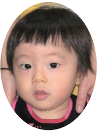
長利元大ちゃん (上豊岡)