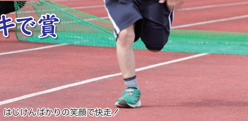
はじけんばかりの笑顔で快走！