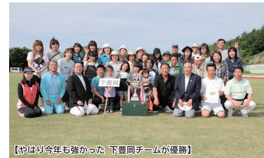
【やはり今年も強かった 下豊岡チームが優勝】