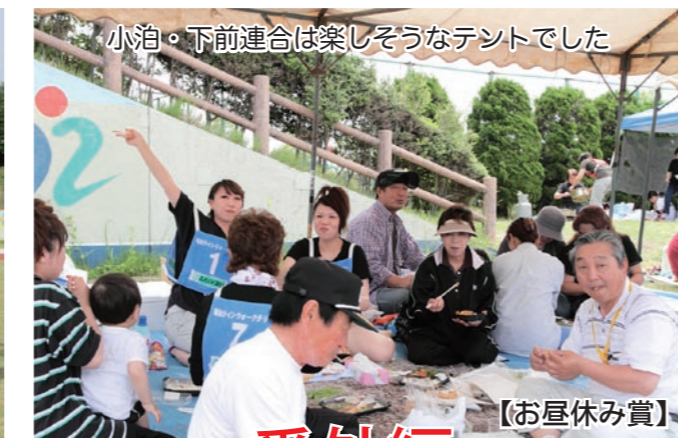
小泊・下前連合は楽しそうなテントでした