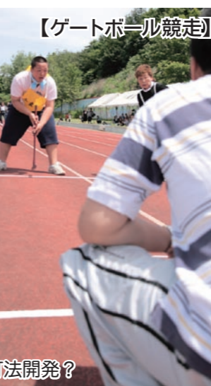
【ゲートボール競走】