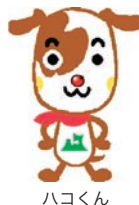
あおもり・ふるさと納税犬