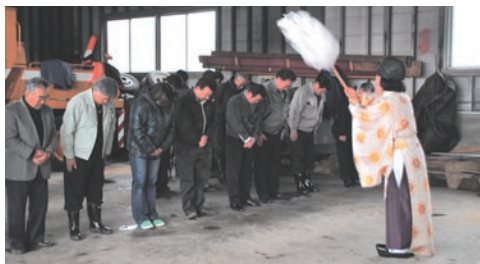
◀除雪隊結団式の様子(12月8日)