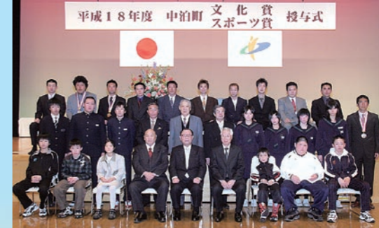
文化賞・スポーツ賞授与式【2/18】