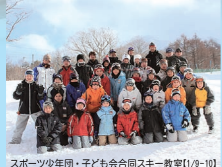
スポーツ少年団・子ども会合同スキー教室【1/9-10】