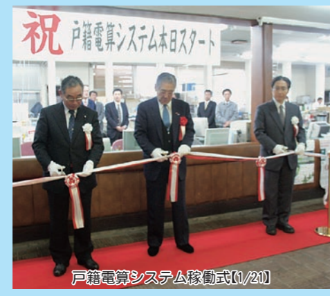
戸籍電算システム稼働式【1/21】