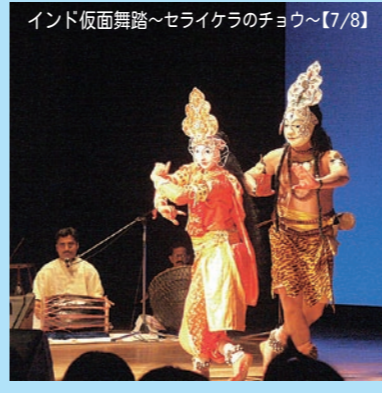
インド仮面舞踏～セライケラのチョウ～【7/8】