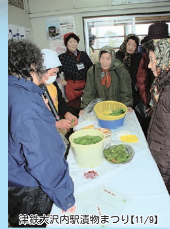
津軽大沢内駅漬物まつり【11/9】