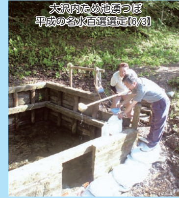
大沢内ため池湧つぽ 平成の名水百選選定【6/30】