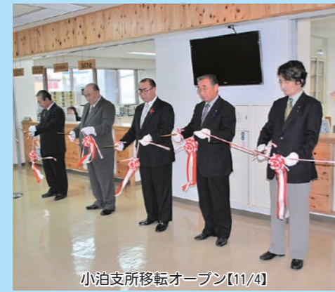
小泊支所移転オープン【11/4】