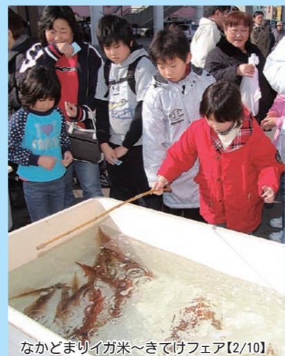
なかとまりイガ米～きてけフェア【2/10】