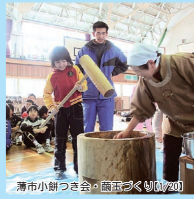
薄市小餅つき会・蕪玉づくり【1/20】