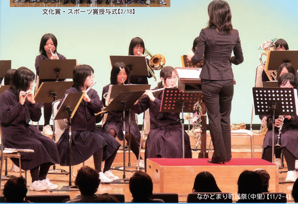
なかとまり町民祭(中里)【11/2-4】