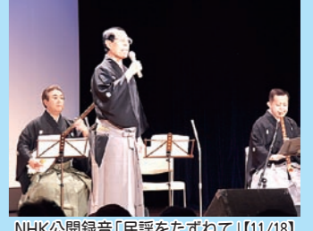
NHK公開録音「民謡をたずねて」【11/18】