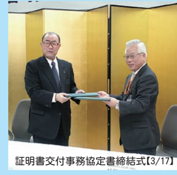
証明書交付事務協定書締結式【3/17】