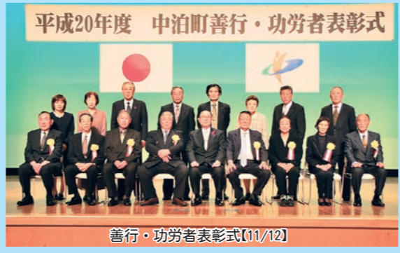
善行・功労者表彰式【11/12】