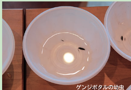
ゲンジボタルの幼虫