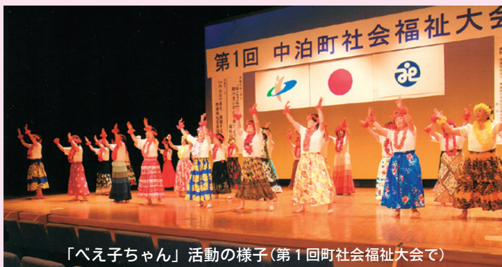
「ベえ子ちゃん」活動の様子(第1回町社会福祉大会で)

「ベえ子ちゃん」が「青森県ふるさとづくり活動理事長賞」を受賞し、ホテル青森で表彰が行われました。